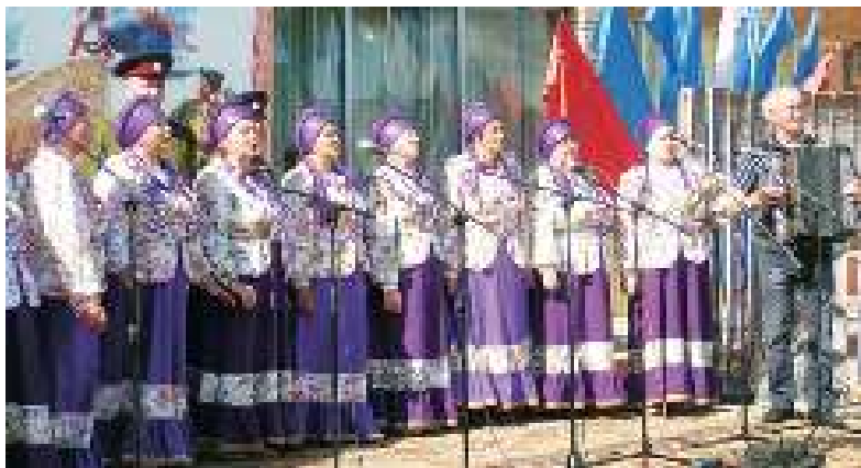
▲ Выступает хор «Казачье раздолье» из Больше-Дорохово.