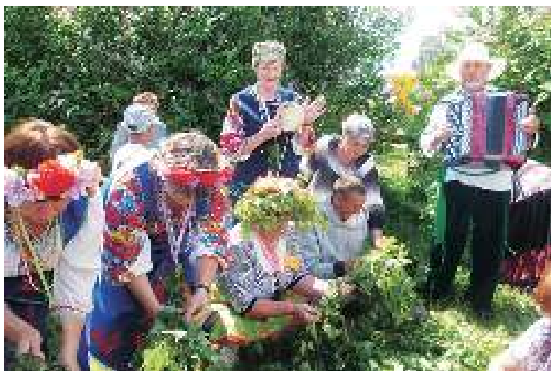
▲ Веники для бани вязали под аккомпанемент гармошки.