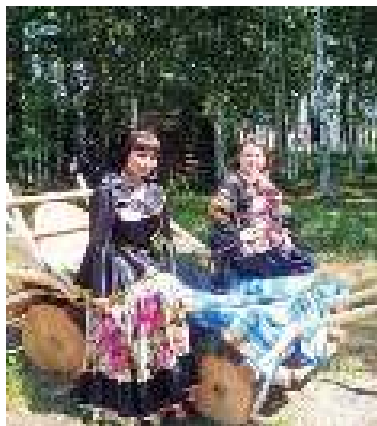
▲ Костюмированная фотосессия в «сказочном лесу».

Уже седьмой год подряд Зырянский район отмечает День России фестивалем народных культур в селе Высоком «Россия — это мы»