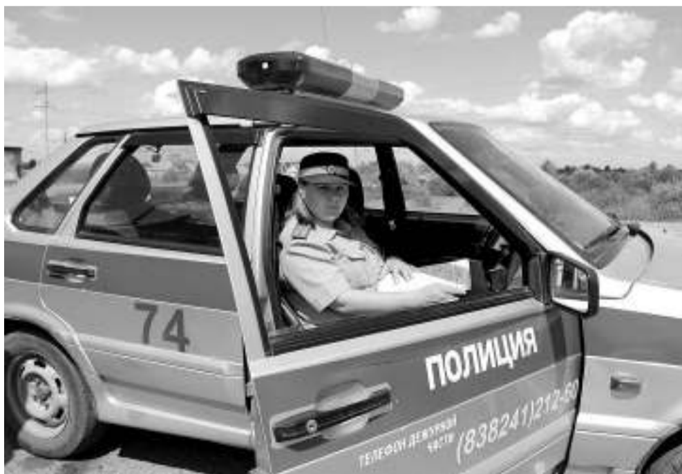
Женщины-инспектора участвуют в патрулировании дорог.