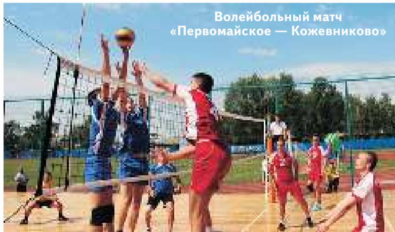
Волейбольный матч «Первомайское — Кожевниково»