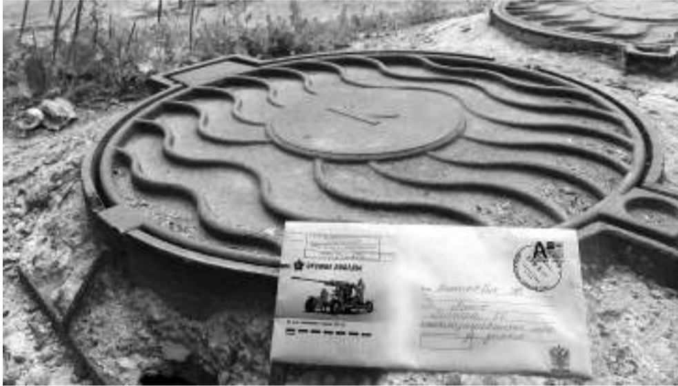
Письмо, отправленное на улицу Ленина, 66, в канализационный люк за домом, так и не нашло своего адресата.