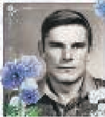
Жена, сын, сноха.