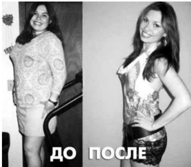
Такой эффект похудения, как предлагают в рекламе, соблазнил бы кого угодно!

Д ень первый. Утро. Дети в школе и садике, муж на работе. Оставшись одна, достаю пакетик зелёного кофе, высыпаю в кружку и наливаю кипятка. Пахнет заманчиво, да и пить практически приятно, не