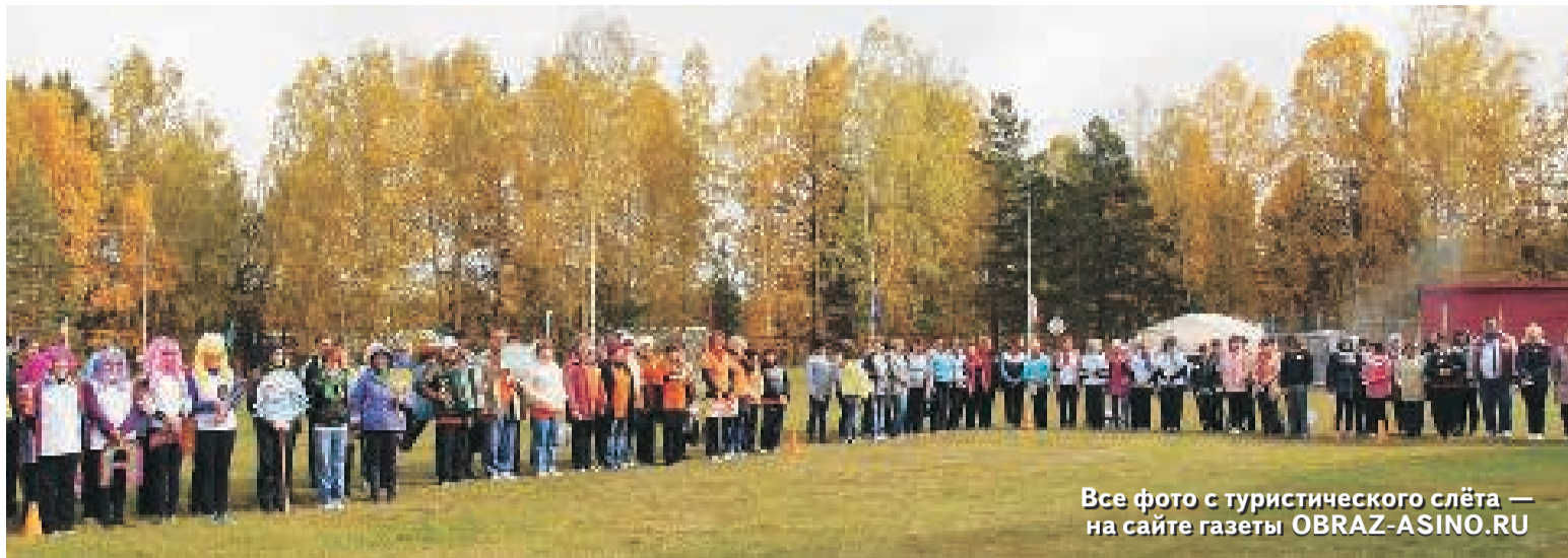
Все фото с туристического слёта — на сайте газеты OBRAZ-ASINO.RU