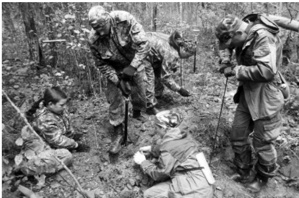
▲ Поисковики Первомайского района уже в третий раз приняли участие в очередной Вахте памяти, которая проходила в Смоленской области.

В Вахте памяти участвовали два священника, которые каждый вечер проводили поминальную молитву. Возле временки с найденными останками павших бойцов был установлен православный крест с почитаемой всеми поисковиками