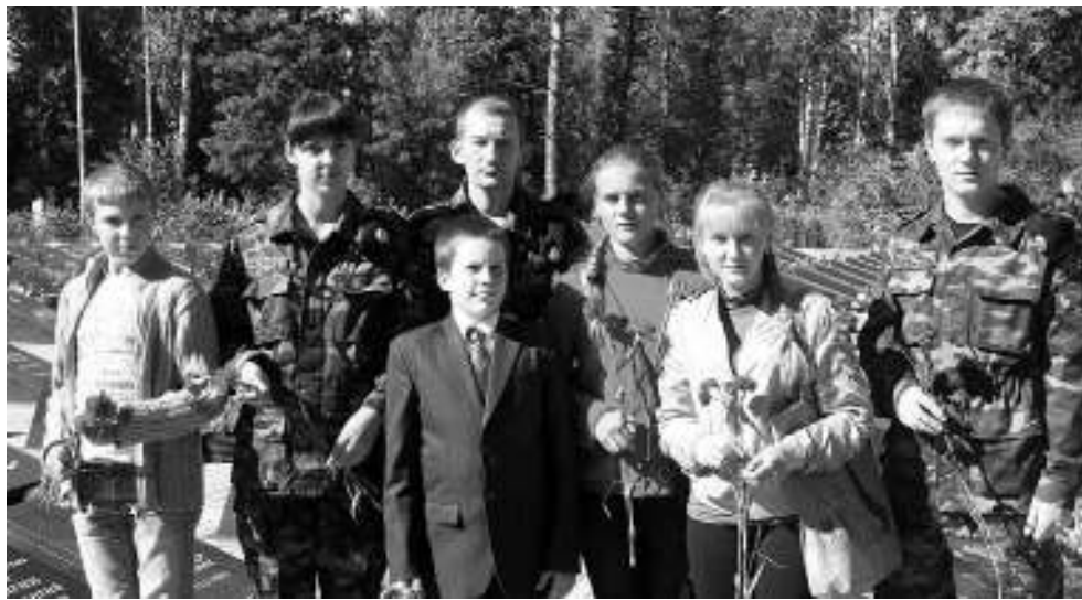
▼ Краеведы Первомайской средней школы побывали в Томске на торжественной церемонии захоронения останков воинов-томичей.

иконой Пресвятой Богородицы «Взыскание погибших». Поисковики собирались около него каждый вечер, молились, ставили свечи. Было ощущение, что души бойцов находятся рядом и благодарят за то, что их нашли и вскоре похоронят там, куда к ним могут приехать их потомки.