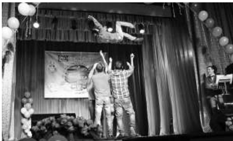
Многие номера команды «Жара» были зрелищными.