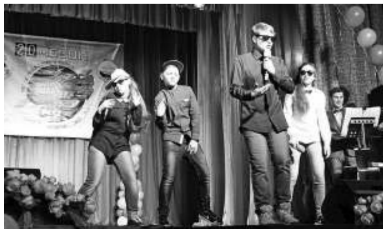
Хорошим вокалом и артистизмом выделялась «Акуна Матата».