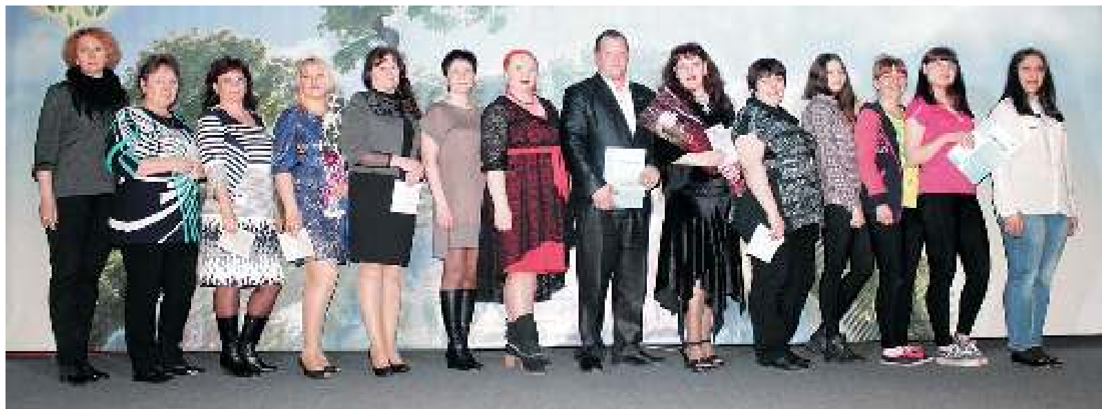
Участники «Кулинарного поединка» сфотографировались на память.