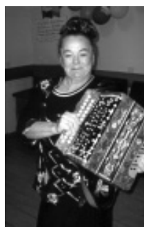
Дочь, внук, сын, брат.

Одной звездой стало меньше на Земле, Одной звездой стало больше на небе. Когда уходит близкий человек, В душе остаётся пустота, Которую ничем не залечить. Как жаль, что твоя жизнь Была такой короткой, Но вечной будет память о тебе. Тебя уже нет, а мы не верим, В душе у нас ты навсегда. И боль свою от той потери Не залечить нам никогда. Великой скорби не измерить, Слезам горю не помочь, Тебя нет с нами, но навеки В сердцах ты наших не умрешь.