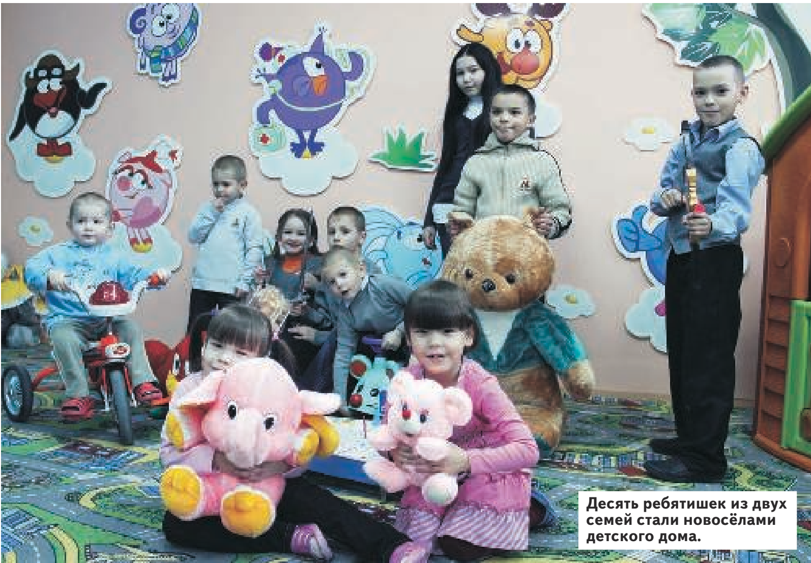
Десять ребятишек из двух семей стали новосёлами детского дома.