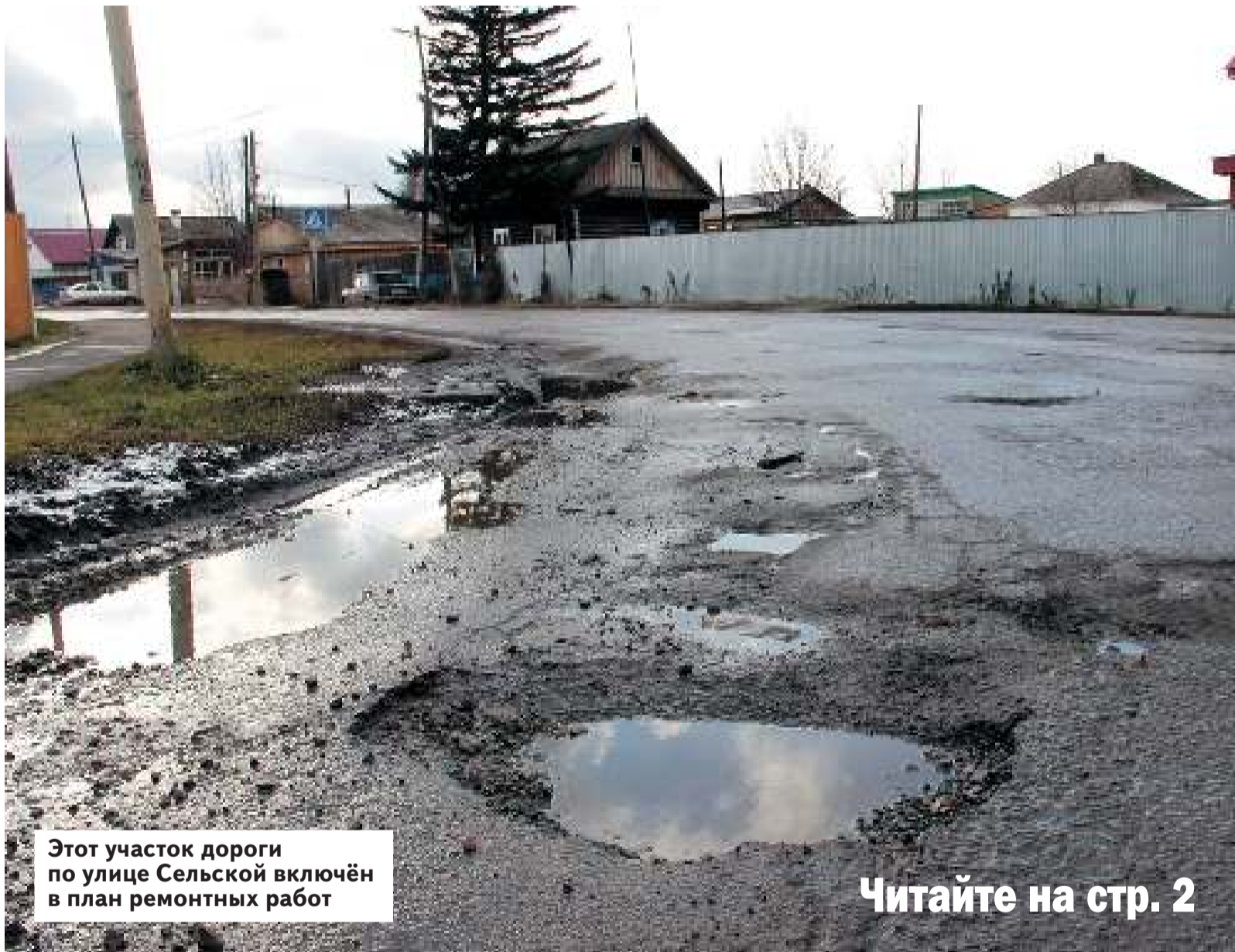
Этот участок дороги по улице Сельской включён в план ремонтных работ

Стало известно, какие дороги отремонтируют в Асиновском районе в 2018 году