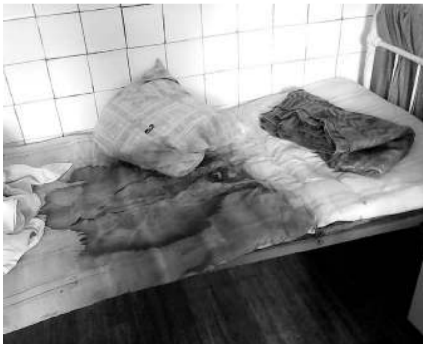
На кроватях лежат старые матрасы, впитавшие в себя не один литр крови.