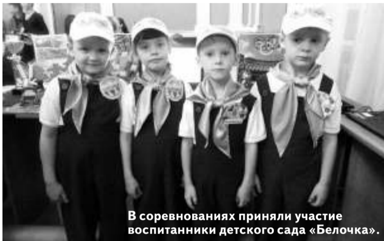
В соревнованиях приняли участие воспитанники детского сада «Белочка».

В фестивале на кубок главы района приняли участие местные детские сады «Светлячок» и «Родничок», ученики Первомайской, Куяновской, Беляйской школ, Центра дообразования. Конкуренцию им составили асиновские малыши из детских садов «Радуга», «Алёнушка», «Белочка», «Сказка», ученики школы №4 и гимназии №2, а также ребята, посещающие Центр творчества детей и молодёжи. На предыдущих соревнованиях весной этого года переходящий кубок забрали юные конструкторы из Асиновского ЦТДМ, однако на этот раз реванш взяли первомайцы, завоевав в командном первенстве сразу два призовых места: обладателями главной награды стали ребята из Центра дообразо-