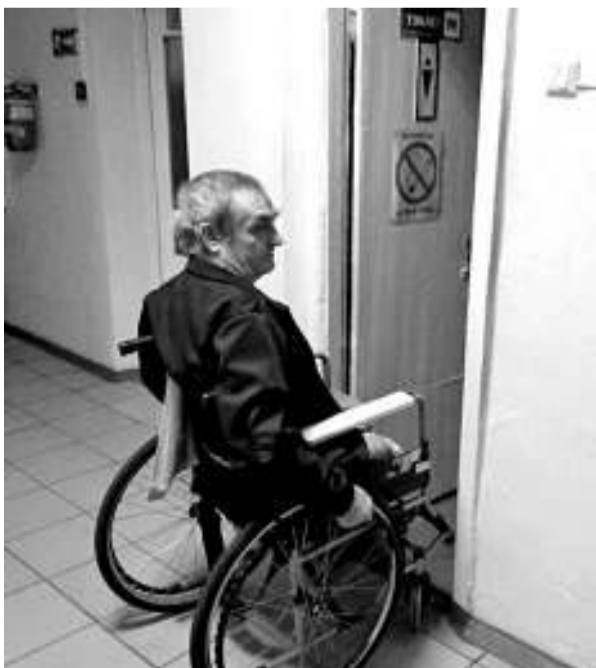
Пациенты-колясочники хирургического отделения не могут попасть в туалет из-за узкого дверного проёма.

— Когда я только пришёл сюда работать, на самом деле были проблемы как с качеством пищи, так и с выполнением санитарно-эпидемиологических норм. Мы с коллегами пришли к мнению, что больничное питание нужно передать на аутсорсинг, то есть привлечь специализирующуюся на этом виде деятельности компанию. Аукцион на выполнение технического задания выиграло ООО «Здоровое питание», которое сегодня не только арендует наш пищеблок, но и вкладывает свои средства в его ремонт и оборудование. Работает предприятие по методу «таблет-питания», который заключается в том, что еда в пищеблоке раскладывается индивидуальными порциями в специальную посуду, которую помещают на герметичные подносы, позволяющие сохранить блюда горячими. Контроль за качеством питания ежедневно ведёт наш диетврач. Порошковое молоко и картофель не запрещены к использованию, тем не менее мы учли пожелания пациентов, и с ноября никакой пищевой порошок использоваться в приготовлении блюд не будет. Фирма закупила необходимое количество натуральных продуктов. Конечно, больничная пища — не домашние разносолы, но она соответствует нормативам.