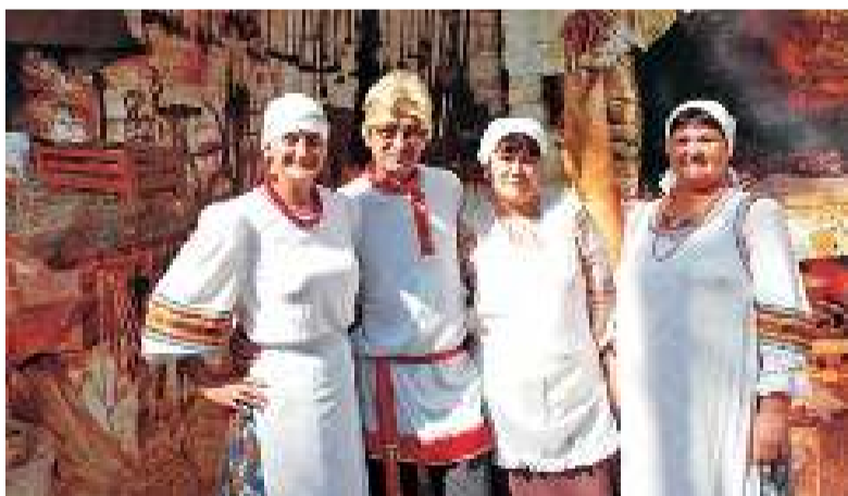
Новиколаевцы сваривают самую вкусную «Кашу из топора».