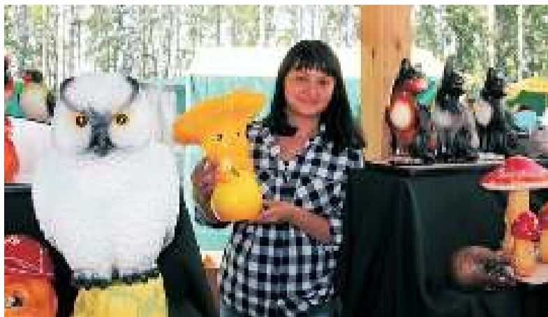
Всё самое лучшее привезла туендатская сувенирная мастерская А.Золотарёва.

Перечислить всё увиденное в одном репортаже невозможно, скажу лишь одно: по масштабу, полученным впечатлениям круче этого фестиваля я, пожалуй, ничего ещё в своей жизни не видела. Как отметили организаторы праздника, одиннадцатый международный томский фестиваль-конкурс народных ремёсел «Праздник топора» стал самым массовым в истории проведения: в мероприятиях приняли участие более 150 тысяч гостей, мастеров и артистов.