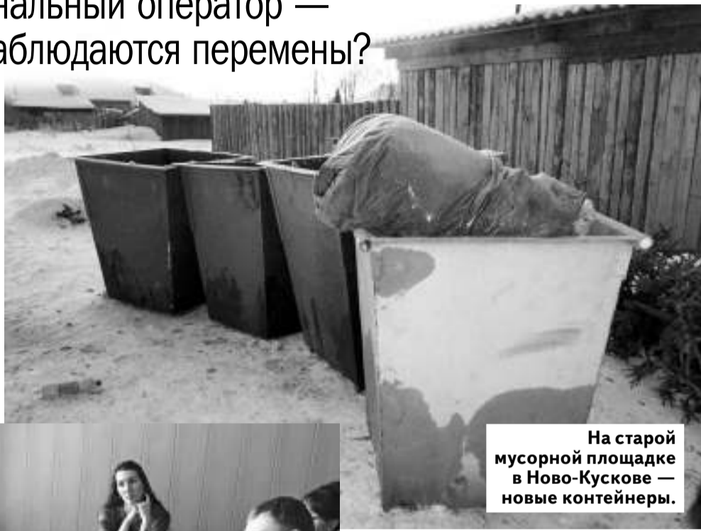
На старой мусорной площадке в Ново-Кускове — новые контейнеры.

Как стало известно, новыми ценами заинтересовались томские эксперты Общероссийского народного фронта, запустив мониторинг тарифов, чтобы оценить, насколько обоснованы те суммы, которые граждане будут ежемесячно платить за вывоз мусора, пока нет ни мусоросортировочного комплекса, ни мусоросжигательного завода. Более того, у нас в районе, например, вывоз и захоронение отходов осуществляются всё тем же Спецавтохозяйством (с которым оператор заключил временный договор)