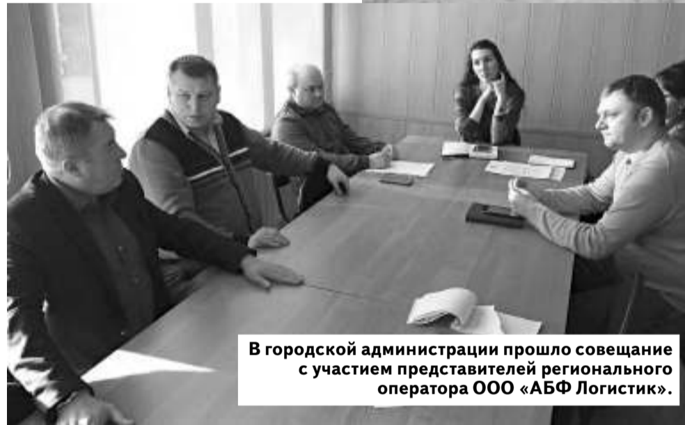
В городской администрации прошло совещание с участием представителей регионального оператора ООО «АБФ Логистик».

Что касается индивидуальных предпринимателей и организаций, то им кон-