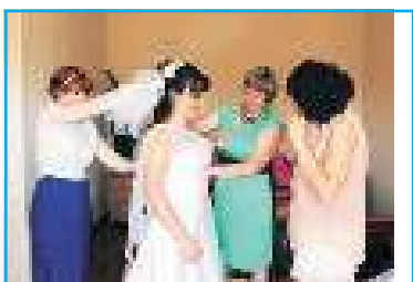
ТИЛИ-ТИЛИ ТЕСТО, В ГОСТИНИЦЕ — НЕВЕСТА!