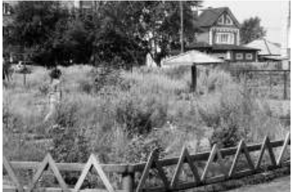
Детская площадка во дворе дома по ул. Партизанской, 70 вся заросла бурьяном.

В благоустроенную квартиру я переехала 8 месяцев назад, а привыкнуть к новому месту жительства никак не могу. Дело не в квартире, а в дворе. У меня и в огороде, и около дома всегда порядок был, поэтому на это безобразие спокойно смотреть не могу. Двор здесь большой, ограниченный четырьмя пятиэтажками (Партизанская, 70 и 72, Рабочая, 91, Советская, 19), но в каком он состоянии! Весь зарос бурьяном в человеческий рост. И родители совершенно спокойно смотрят, как в этом «лесу» играют их дети. Слов нет, чтобы выразить возмущение безразличием людей. Да если бы с каждого этажа хотя бы по од-