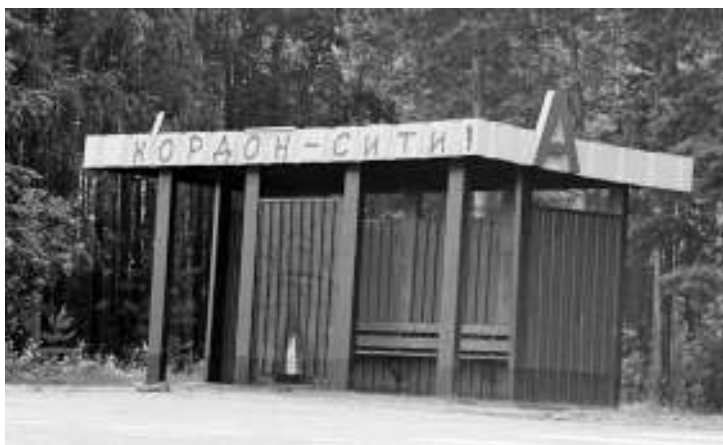
«Кордон-Сити! — это звучит гордо», — подумал один из жителей посёлка и собственноручно его переименовал. Знай наших!