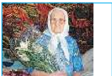
РОДИЛАСЬ ПРИ ЦАРЕ НИКОЛАЕ II