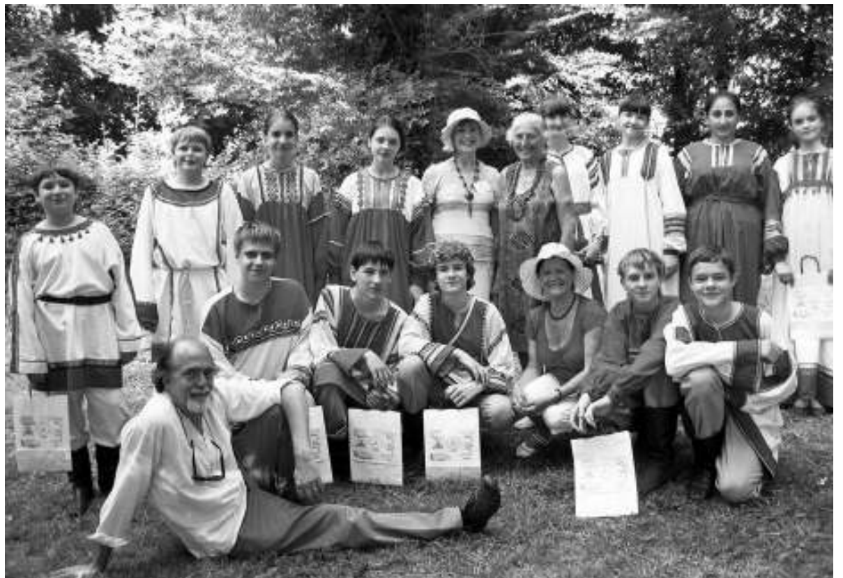
▲ Фото на память с группой поддержки.

В один из дней на фестиваль приехала группа поддержки асиновских конкурсантов: наша землячка, учительница фран-