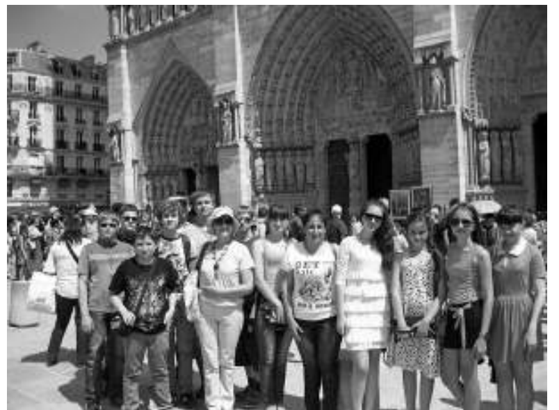
▼ У стен Нотр-Дама в Париже.

плотный график зарубежной жизни, потому что «Роза ветров» — это не только конкурс, но и обширная культурно-образовательная программа. Ребята расширили кругозор в области истории и географии. Они смогли побывать в исторических центрах Европы: в Варшаве, Париже, Дрездене. По их словам, больше всего им запомнилась Париж его Эйфелевой башней, Лувром, Елисейскими полями, собором Парижской Богоматери, а также Дрезден и его картинная галерея старых мастеров, в которой хранится «Сикстинская Мадонна» Рафаэля. Неизгладимое впечатление оставили поездки к Атлантическому океану, посещение Диснейленда, аквапарк в городе Жонзаки океанариума в городе Ля-Рошель.