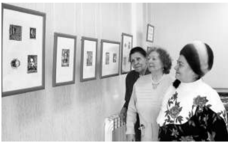
После торжественной части гостям было предложено ознакомиться с уникальными экспонатами музея графики.

Проникновенные стихи, посвящённые Василию Кеменову,