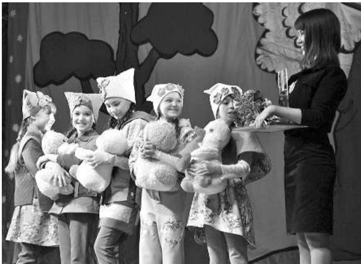
Коллекция «Весна — растворитель зимы» из Асиновского техникума промышленной индустрии и сервиса признана лучшей в номинации «Детская одежда».