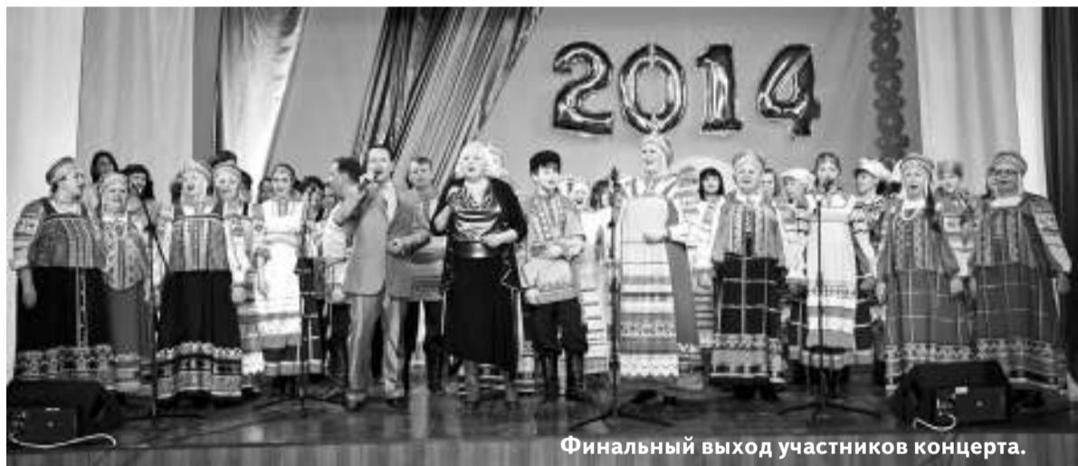
Финальный выход участников концерта.

Отразить за один вечер всю многогранную деятельность учреждений культуры было непросто, но организаторы мероприятия постарались это сделать. К примеру, о работе библиотекарей поведали красочные фотослайды, выведенные на большой экран. По фотографиям можно