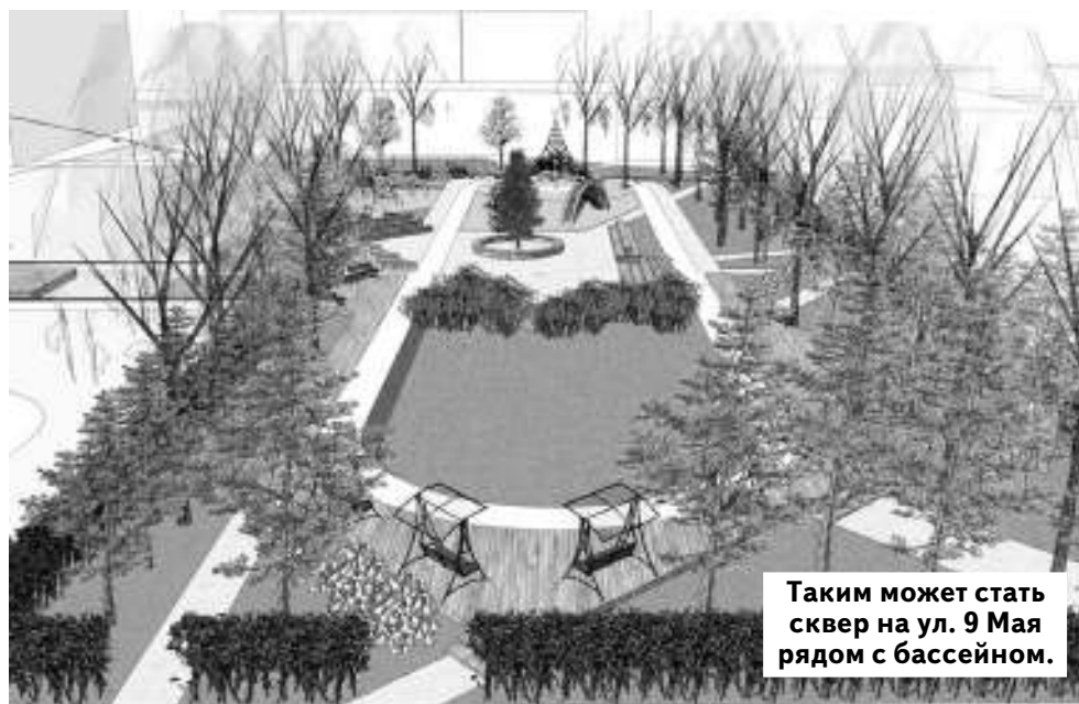
Таким может стать сквер на ул. 9 Мая рядом с бассейном.