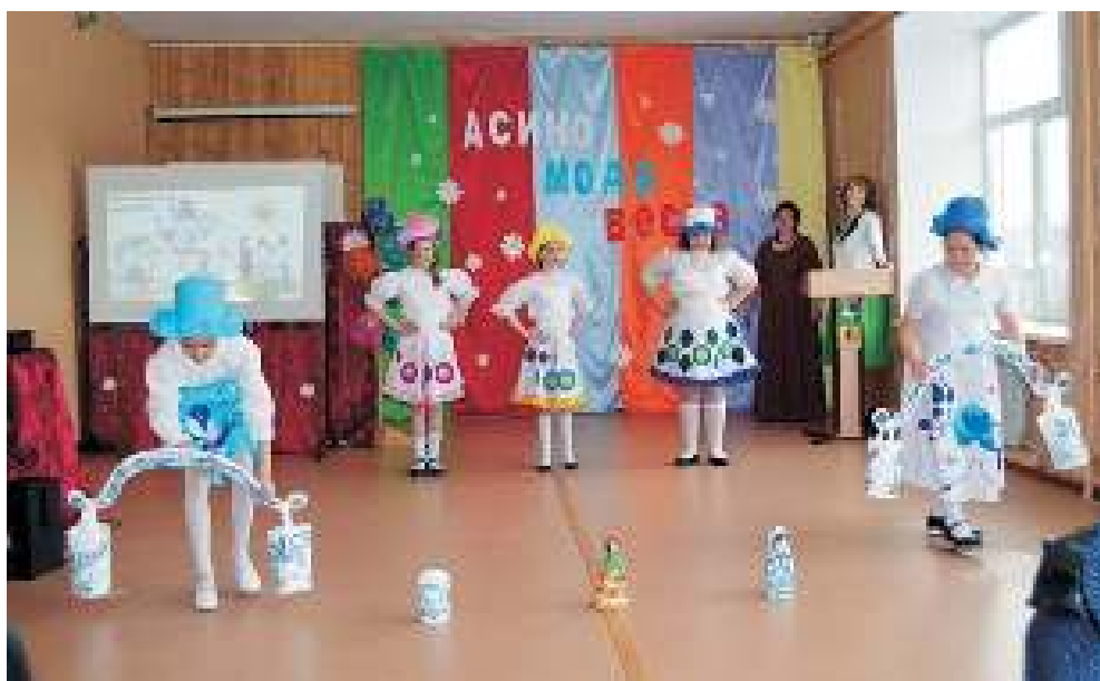
Каждый год девочки на уроках труда шьют новую коллекцию костюмов и потом устраивают дефиле для друзей и родителей.

Я поинтересовалась, какие возможности есть у детей, которые проходят успешнее всех школьную программу. Получив свидетельство об окончании 9 классов, они могут выбрать для обучения техникум, где есть условия для детей с ограниченными возможностями здоровья. Так, например, в АТпромИС они осваивают швейное и столярное дело. Примут таких ребят в Первомайский филиал Томского аграрного колледжа и некоторые томские образовательные учреждения.