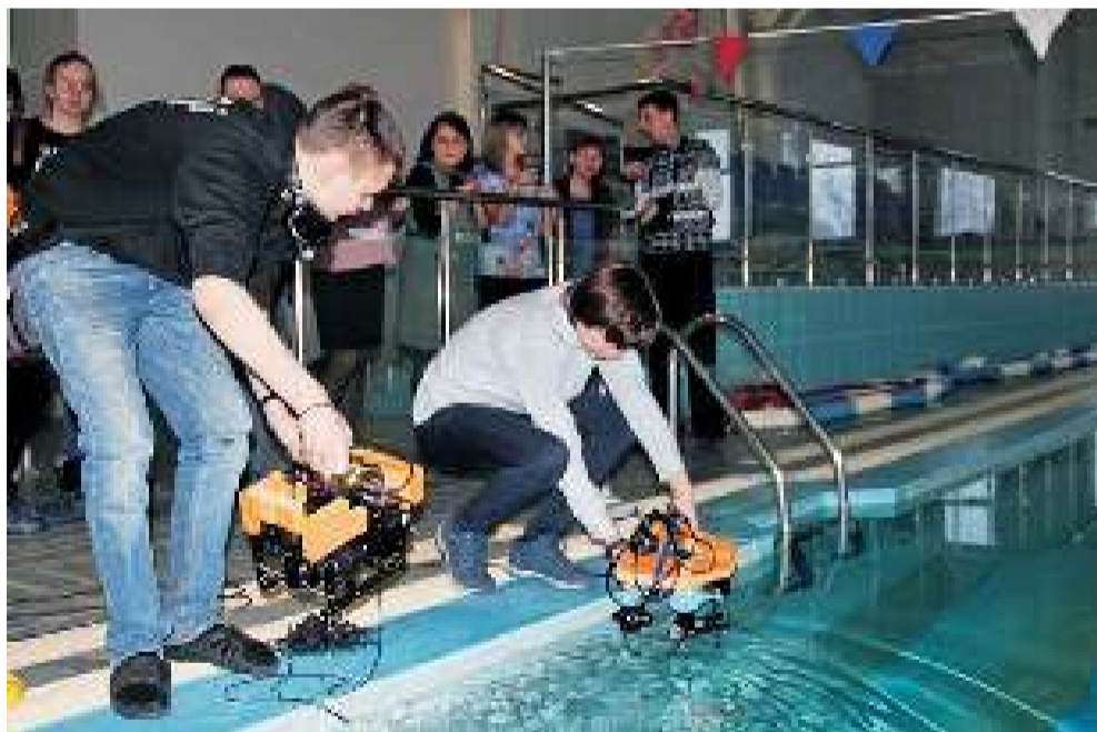
Роботы к погружению готовы.

15 и 16 января в Асине проходили первые в Сибири соревнования по подводной робототехнике