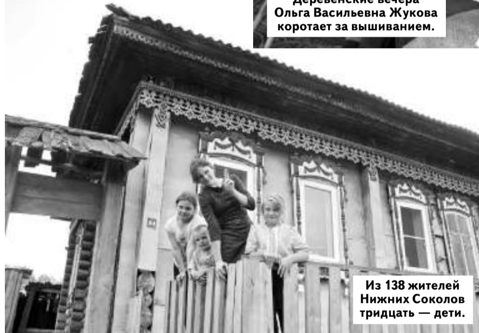
Из 138 жителей Нижних Соколов тридцать — дети.

Пройдя сквозь гирлянду сушившихся на бельевой верёвке настиранных детских вещей, иду смотреть, что растёт в деревенском огороде. Есть всё, от картошки до окрепших томатов в теплице.