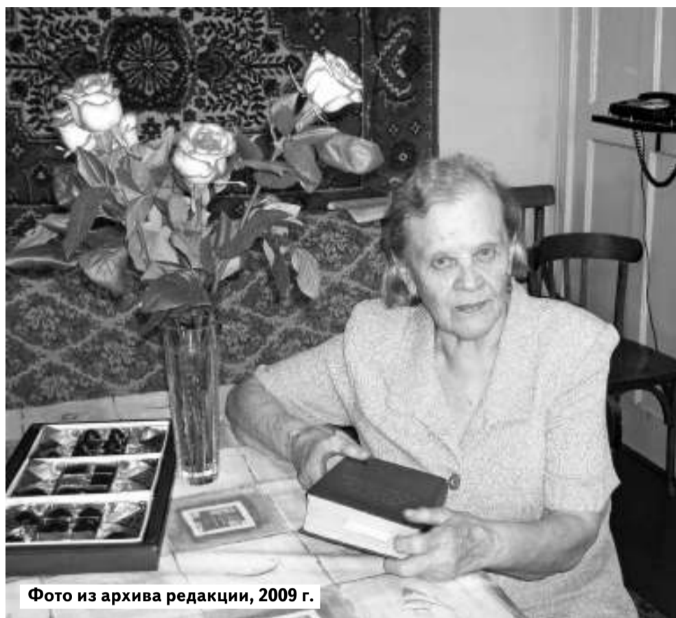
Фото из архива редакции, 2009 г.

В очаги инфекционных заболеваний работники выезжали либо на единственной в СЭС едва живой от недокорма лошадке, запряжённой в зависимости от