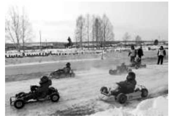
Картингисты соревновались на стадионе Новиковской школы.

А в минувшие выходные стадион Новиковской сельской школы вновь принимал картингистов теперь уже на районные соревнования на призы администрации Новиковского сельского поселения, в которых принимали участие спортсмены из Асино и Новиковки. Это событие закрыло сезон зимних соревнований по картингу.