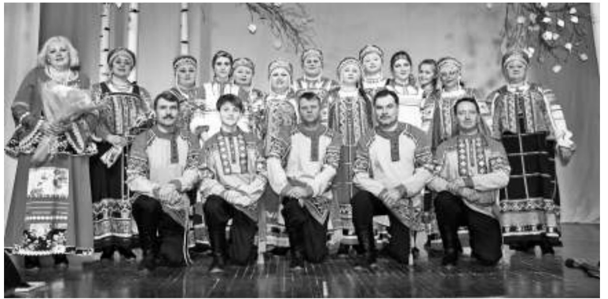
В составе Первомайского ансамбля «Русинка» — восемнадцать человек.

У «Русинки», подтвердившей свой титул в 2013 году, очень много и современных фотографий. Одна из самых памятных и ярких была сделана во время открытия международного фестиваля «Го-