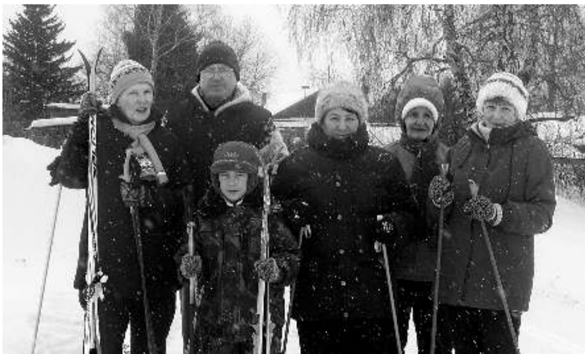
Четыре подруги-пенсионерки из села Зырянского собрали свою спортивную команду, которая ведёт здоровый образ жизни.

— После выхода на пенсию сразу болезни всякие одолевают. Посмотрите, сколько в больнице людей каждый день собираются, ждут своей очереди, злятся друг на друга, ссорятся. А мы стараемся в больницу не ходить. Лучше на свежем воздухе пробежаться, пообщаться, пошутить да повеселиться. Посмотрите, какая у нас здесь красота, простор, природа замечательная! Вот мы и заряжаемся от природы позитивом. Я вот лыжи не нашла, так скандинавской