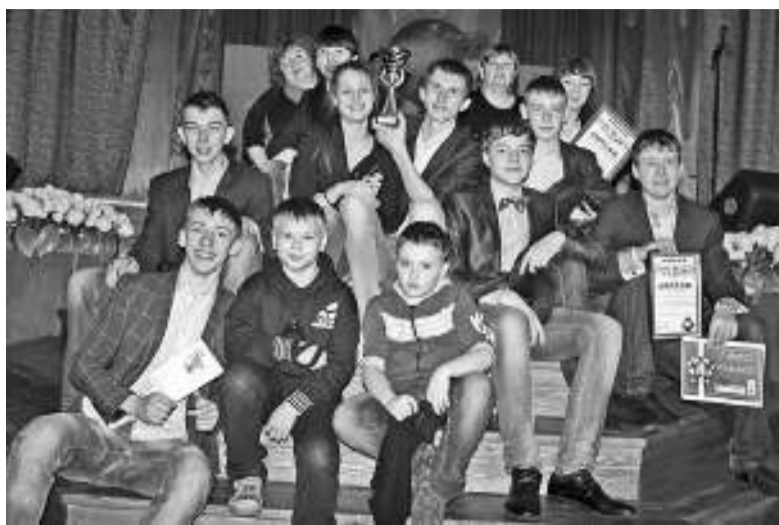
Победителем восемнадцатого сезона КВН стала команда «Внуки лейтенанта Шмидта» школы №4.

Окрылённые первым успехом ребята с каждым новым конкурсом набирали обороты. Соперники им в этом «помогали». К примеру, в «биатлоне» «Акуна-Матата» выкинула такую пошлость, что члены жюри отказались вообще выставлять оценки, напоминая, что главная тема 18-го сезона — «Культура без границ». А тут прозвучало такое бескультурье, что всем си-