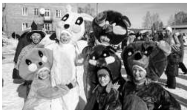
Дети участвовали в весёлых аттракционах и конкурсах, которые подготовили работники культуры.

Не хлебом единым сыт человек: душа требует развлечений. Ребята из театральной студии «Созвездие» зазывали народ горячим чаем, бутербродами, пирож-