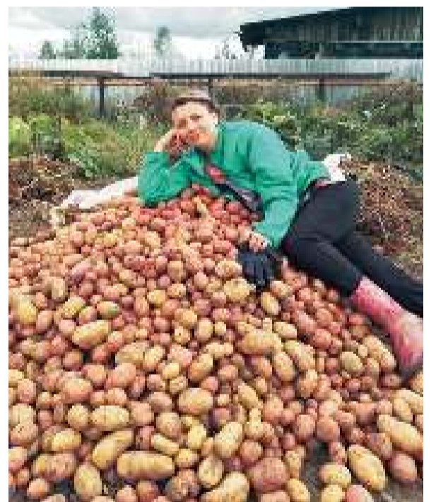
Отдохну и дальше пойду!