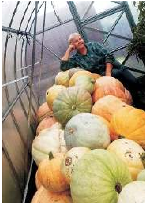
Тыква выросла на грядке — Не поднимете, ребята! Если ягода она, То, наверно, для слона!

На фото только часть урожая. Даже наша корова хрумкает тыкву.