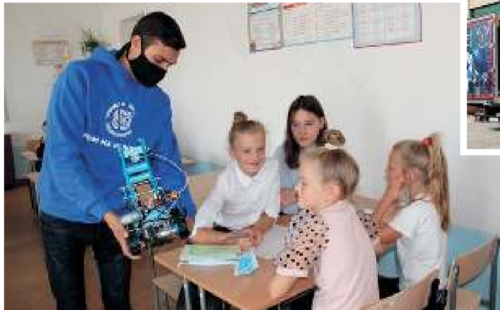
Ученики из Ягодного разбираются в устройстве робота.