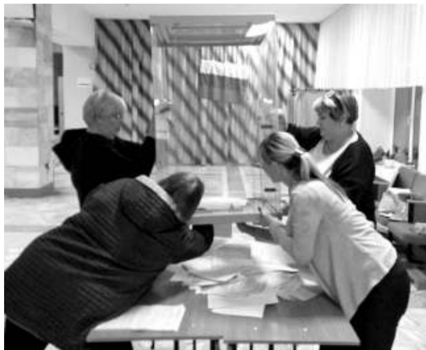
Извлекают бюллетени из ящика члены УИК №286 (с. Новокусово).

Многие асиновцы воспользовались возможностью проголосовать досрочно: в период со 2 по 8 сентября — в кабинете территориальной комиссии и с 9 по 12 сентября — на своих избирательных участках. Таким образом досрочно выразили своё волеизъявление 1486 жителей Асиновского района. Немало оказалось и тех, кто, не имея возможности посетить участок самостоятельно, пригласил членов УИК на дом — 1004 человека.