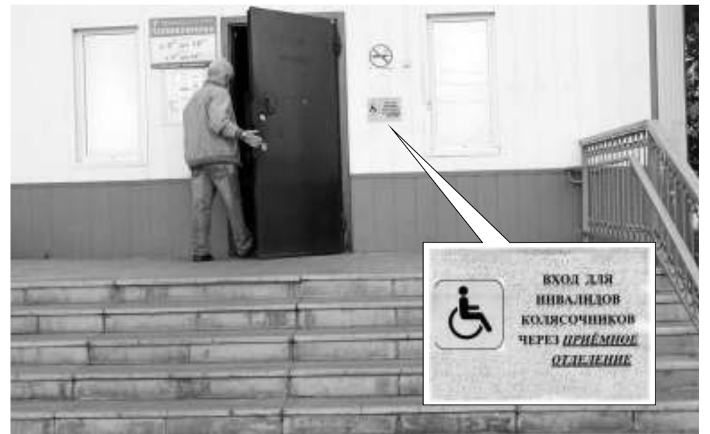
ВХОД ДЛЯ ИНВАЛИДОВ КОЛЯСОЧНИКОВ ЧЕРЕЗ ПРИЁМНОЕ ОТДЕЛЕНИЕ

Свои надежды на решение вопроса о переносе стоматологического отделения администрация АРБ связывает с перспективой строительства новой детской поликлиники. Когда детская поликлиника переедет в новое здание, на её место планируется перевести стоматологию. Но о датах говорить пока рано: сами знаете, что разговоры о строительстве ведутся давно. До конца этого года будет завершено изготовление проектно-сметной документации за счёт средств областного бюджета. Ожидается, что решение о финансировании из федерального бюджета будет принято на следующий год. Если, конечно, пандемия коронавирусной инфекции в эти планы не внесёт свои поправки.