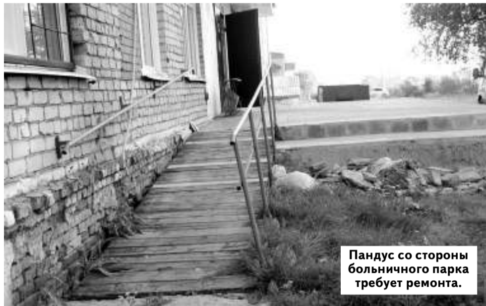
Пандус со стороны больничного парка требует ремонта.

С 2011 года в России действует социальная программа «Доступная среда», в