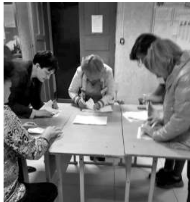
Идёт подсчёт голосов на участке, расположенном в ЦТДМ (округ №6).