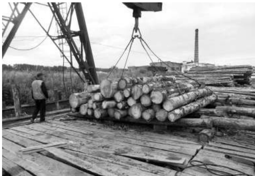
На участке лесопиления идёт разгрузка.

Самый горячий в прямом смысле слова — участок металлообработки. В момент моего посещения добела раскалённый металл в ловких руках кузнеца превращался в витиеватый завиток для украшения будущего изделия. На заказ здесь делают шампуры, мангалы, кованые заборы, банные печи. Сотрудничают с ИК-2 администрации районов. Так, например, по заказу Асиновской администрации в этом году здесь были изготовлены мусорные контейнеры. Первомайская администрация заказала кованые беседки для украшения села. Также на участке металлообработки производят совковые лопаты и комплектующие для отбойных мо-