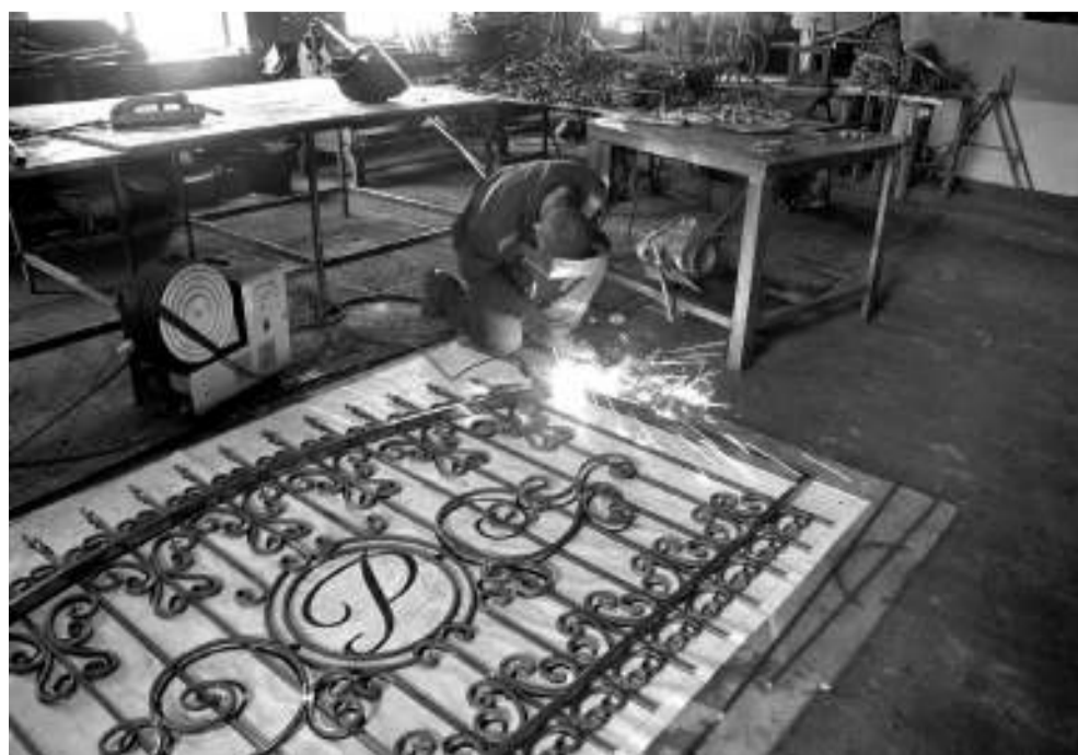
В цехе металлообработки всегда кипит работа.