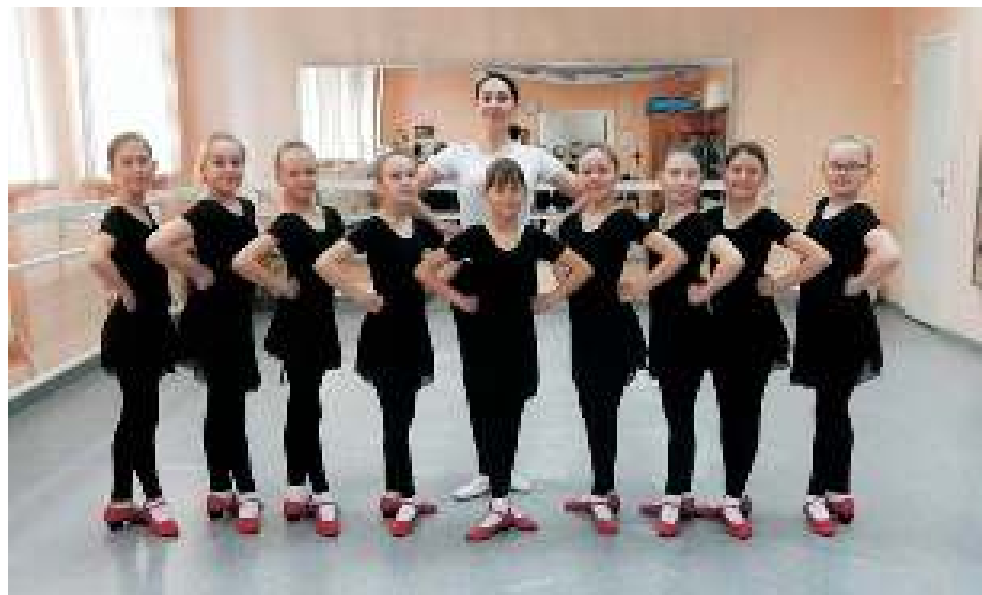
На занятии в ДШИ с ансамблем «Непоседы».

— На первых занятиях нам с супругой казалось, что мы чересчур строжимся, перегибаем палку. Думали: ну всё, разбегутся. А нет. На следующее занятие приходим — все в сборе. Во взрослой группе — своя специфика. У всех семьи, куча домашних дел. Нам бы ещё над номером потрудиться, но надо понимать, что женщин ждут дома. Хотя относятся они к занятиям очень ответственно, не пропускают их без веской причи-