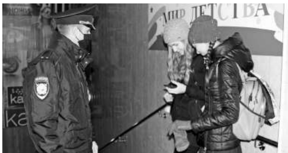
А вот и первые нарушители. Две девушки без масок в фойе магазина беззаботно «зависли» в своих телефонах.