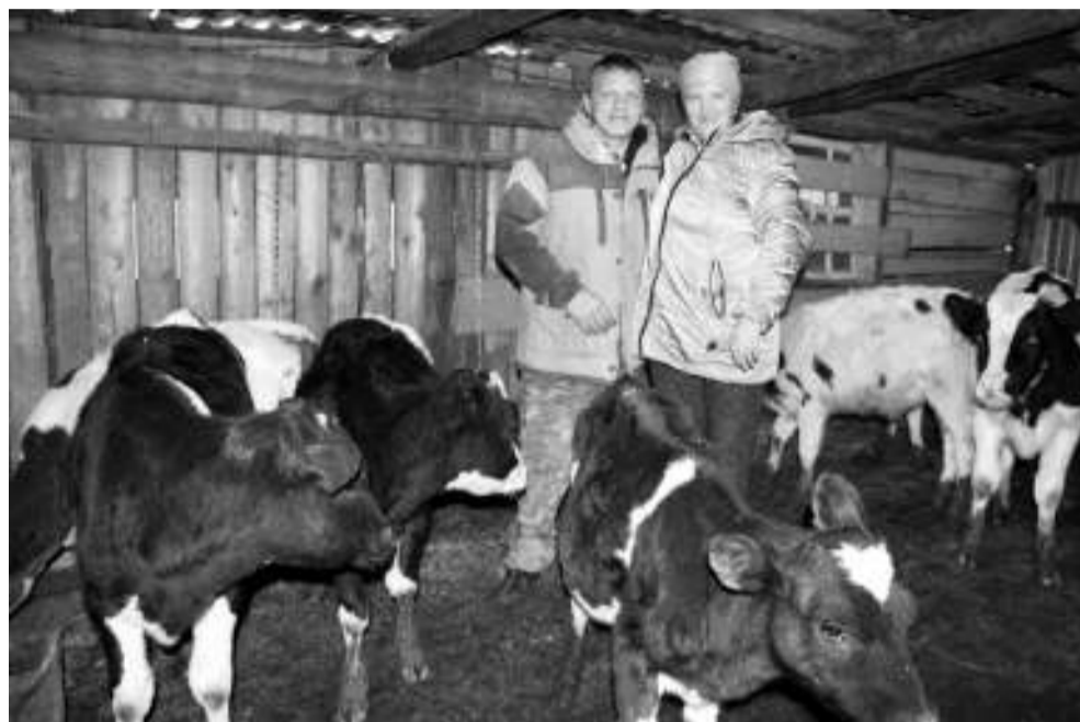
Среди поголовья КРС есть и молодняк.

— Как можем, так и выкручиваемся, — говорят супруги. — Когда есть жела-