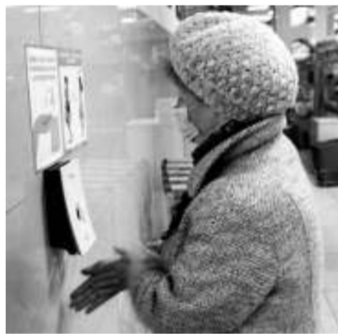
На входе в магазин многие покупатели обрабатывают антисептиком руки и берут одноразовые маски.

Открываем двери популярного в городе торгового центра, где размещается сразу несколько магазинов: «Карри», «Золушка», «Fix Price». А вот и первые нарушители. Две девушки без масок в фойе беззаботно «зависли» в своих телефонах. «Но мы же не в самом магазине», — оправдываются они перед сотрудниками полиции, которые объясняют, что маски нужно надевать ещё до входа в общественное место. Девчонки тут же вынимают маски из своих карманов, что и спасает их от составления протоколов. Нужно отметить, что полиция штрафы не назначает. Протокол о правонарушении рассматривает суд и прини-