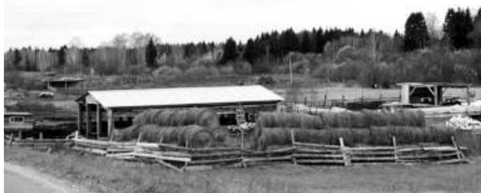
Большой скотный двор находится на краю деревни.