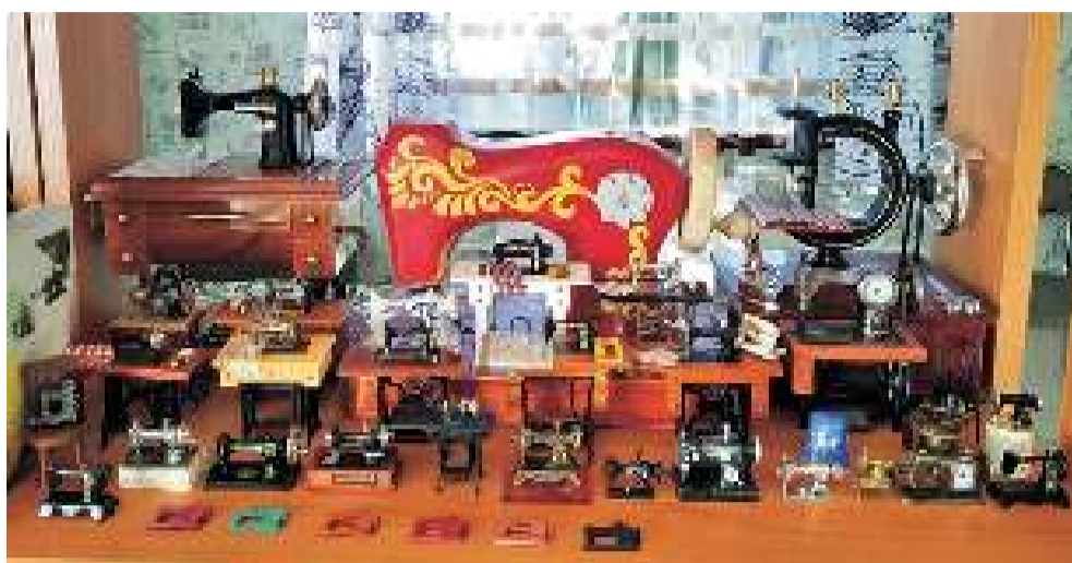
На данный момент в коллекции 101 экземпляр швейных машинок.

друзьями и попросила их, если увидят где-то в продаже, купить или мне сообщить. Лет пять прошло, как я озвучила свою мечту, и вот случилось чудо: 18 января 2014 года ко мне приехала подруга из города Лангепас и подарила статуэтку швейной машинки с кристаллами Сваровски. Именно с неё и началась моя коллекция.