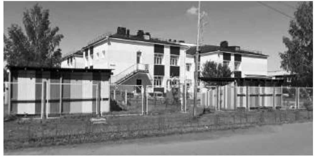
Здание детского сада «Радуга» в микрорайоне Лесозавод построено без малого сорок лет назад силами СУ-24 треста «Томлесстрой».

Многого почерпнул я от своего первого бригадира. Тот, когда надо, мог резко нажать, накричать. Если нужно было разрядить обстановку, шутил. Люди, как и в любом коллективе, были разные: с амбициями и без, пьющие и нет. Но на шею бригадирю сеть никому не удавалось. Он был лидером и формальным, и неформальным тоже. Застолья случались — куда без них на стройке? И без прогулов не обходилось, ведь половина бригады — ребята молодые: лето, танцы, девушки. Оргвыводы следовали? Конечно. И премию урезал бригадир, и в выходные отработывать заставлял. Не по КЗоТу, но справедливо, так что без обид.