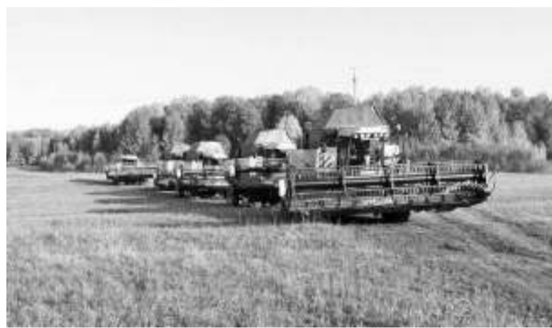
Комбайны ООО «КФХ «Нива» возвращаются с полей на зимнюю стоянку.

На территории Асиновского района, где земледелием занимается восемь сельхозпредприятий, зерновые убранны с 11272 гектаров, урожайность составила 23,1 центнера с гектара. Завершена и уборка рапса, который на площади 1224 гектара возделывали три предприятия: ООО «СОП», ООО «Сибирское молоко» и ООО «КФХ «Нива». Средняя урожайность по этой культуре — 19,7 центнера с гектара. В закрома отправили 2,4 тыс. тонн. Лён-долгунец вытреблен с площади 840 гектаров. Его выращиванием занимается ООО «Томский лён», которое заготовило 235 тонн льноволокна. Лён масличный на площади 392 гектара посеяли этой весной Сибирские органические продукты. Урожай-