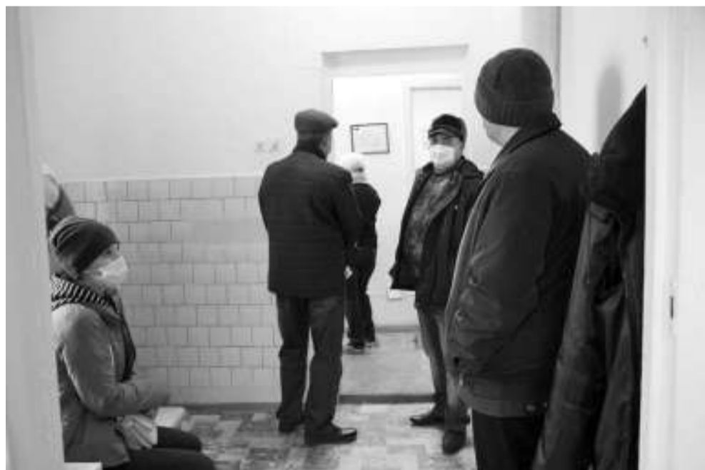
Утром 21 октября в коридоре инфекционного отделения очередь на приём ожидали 17 человек.

В последнее время в редакцию газеты всё чаще стали поступать обращения от асиновцев, обеспокоенных тем, в какой ситуации они оказываются при посещении поликлиники. С чем им пришлось столкнуться, рассказывают три пациентки.