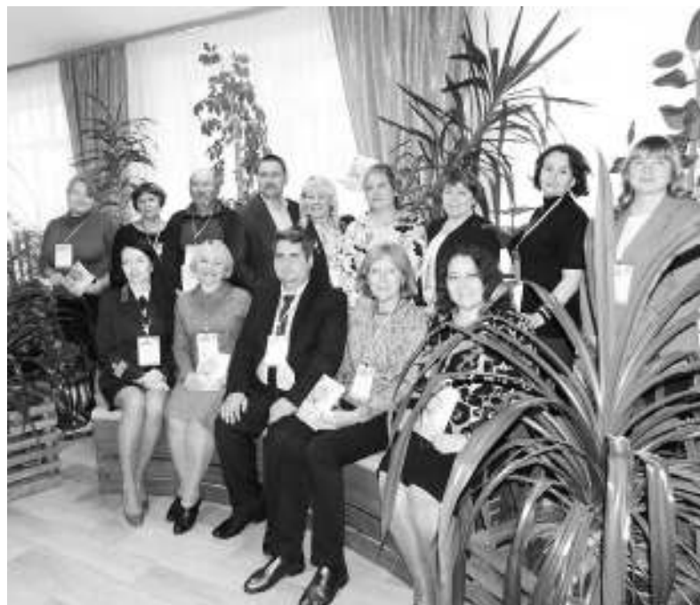
Гости АТПромИС любят фотографироваться в зелёных уголках рекреаций.

Коллектив техникума на протяжении многих лет реализует принципы экологической политики. Здесь отлажена система контроля ресурсопотребления и созданы условия для проведения региональных и российских экологических крупномасштабных мероприятий, организаторами которых выступают педагоги и студенты АТПромИС. Ирина Егорова, начальник воспитательного отдела техникума, комментируя победу коллектива в областном конкурсе, сказала: «Для нас «Зелёный офис» — это учреждение, в котором берегут здоровье сотрудников, эффективно расходуют собственные ресурсы, своим примером формируют экологическую культуру сотрудников, студентов, молодых специалистов и рабочих».