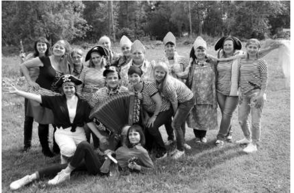
Коллективные выезды на природу не обходятся без переодеваний, сценок, песен и конкурсов.

Однажды устроили нашим мужчинам шуточный суд. «Подсудимые» сидели под вооружённой охраной, а судьи, стороны обвинения и защиты рассматривали их «дела». Ещё один праздник запомнился медкомиссией, где мужчины по-