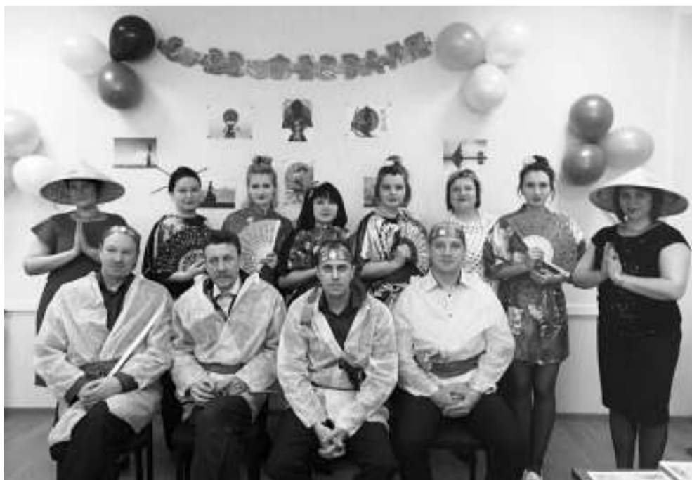
Корпоратив в честь 23 февраля прошёл в японском стиле.

Увы, пандемия-2020 наложила на многие наши мероприятия запрет, но мы всё равно стараемся с пользой проводить время. Этой осенью высадили берёзки на улице 9 Мая и очень надеемся, что весной они порадуют нас изумрудными листочками. Когда пандемия закончится, все мы вернёмся к прежней жизни, где найдётся время не только для работы, но и для отдыха. От имени всего коллектива поздравляю наших ветеранов и всех земляков с Новым годом и наступающим Рождеством! Желаю всем мира и добра!