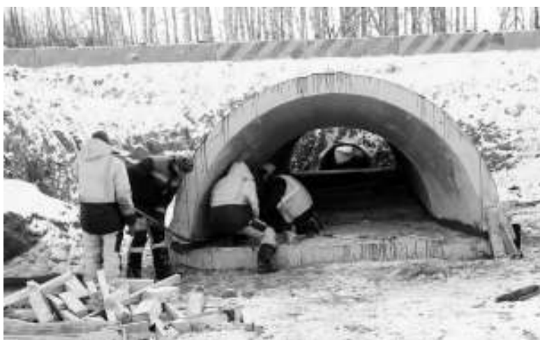
Эта железобетонная водоотводная труба заменит прежнюю.