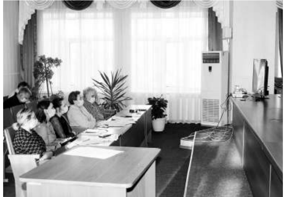
Совещание проходило в режиме видеоконференции.

— Это станет неким подготовительным этапом для перехода на новый порядок налогообложения. В течение это-