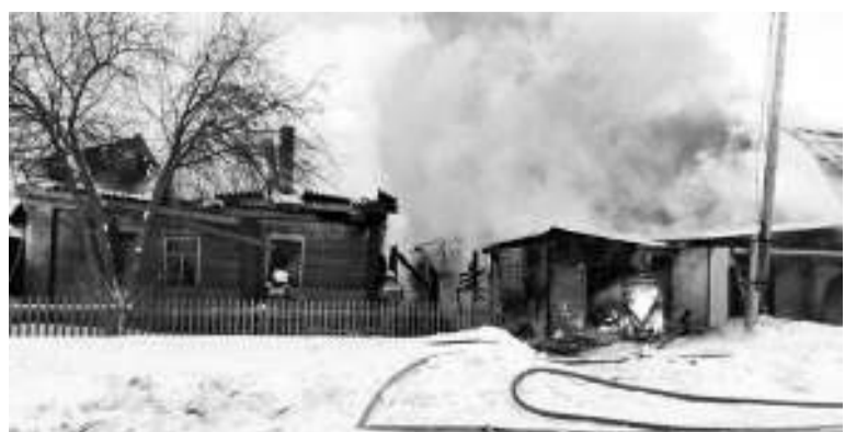
Два дома на улице Линейной пострадали в пожаре 16 января.