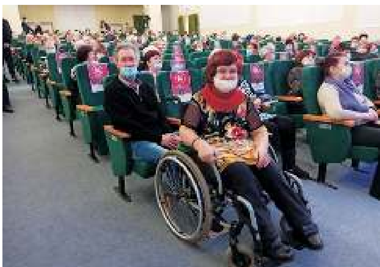
В зрительном зале появились места для инвалидов.

дили в зрительный зал, где предусмотрены специальные места для инвалидных колясок.