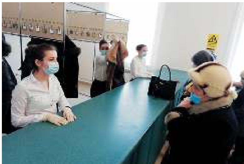
ДК теперь начинается с вешалки.

Тем, кто новый ДК ещё не видел, советую сходить и посмотреть, тем более, что афиша на февраль и март полна творческих событий.