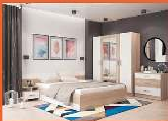
ВСЁ ТОВАР ИМЕЕТСЯ В НАЛИЧИИ