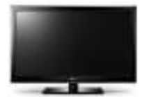
ТЕЛЕВИЗОР ЖК LED ERISSON LES 66 диагональ 81 см