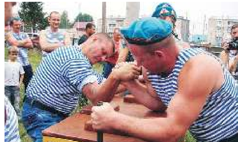
Каждый год в программе празднования Дня ВДВ — возложение цветов к монументу Победы. А вот соревнования по силовым видам спорта и стрельбе для допризывной молодёжи и ветеранов ВДВ состоялись впервые.