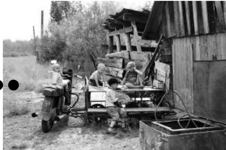
▲ Все дети, которых можно встретить во Францево, приехали погостить.

— За время моей работы на посту главы с 15 октября прошлого года я побывал в посёлке восемь раз. Соглашусь, что многие нарекания жителей справедливы, но в некоторых вопросах они не хотят мне помочь разобраться. Вот, например, обеспечение дровами. Я предлагал три варианта, но ни один люди не поддержали. Закупку дров в Комсомольске считали дорогой услугой. С выделением лесной деляны для самостоятельной заготовки не согласились, потому что не смогли договориться с владельцами имеющихся в деревне