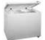
МОРОЗИЛЬНЫЕ ЛАРИ Бирюса, Позис, Gorenje, Kraft от 200 до 600 литров