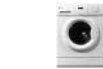
СТИРАЛЬНАЯ МАШИНА-автомат LG F 10 B C 3 LD 5 кг / 1000 об., прямой привод (Ш*Г*В) 60*45*85 см