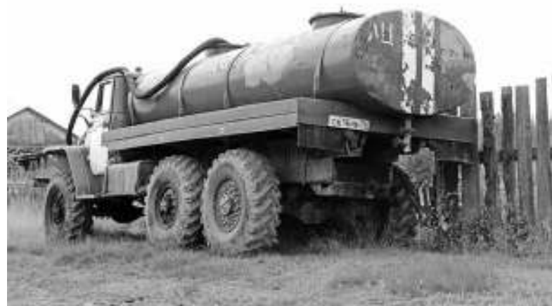
▼ Выделенная деревне пожарная машина оказалась недоукомплектованной: отсутствует пожарный рукав.

тракторов. Можно было пилить топляк, который сегодня образовал затор у моста. Но и это не устроило. Кстати, о заторе. Я обращался к жителям с просьбой помочь ликвидировать скопление брёвен, но откликнулась только одна семья. Точно так же никто не хочет взять на себя ответственность за колонку: по этой причине она и не функционирует. Всё, что требуется, — это назначить ответственного и дать гарантию, что оплачивать электроэнергию (колонка работает от электричества) люди будут вовремя.