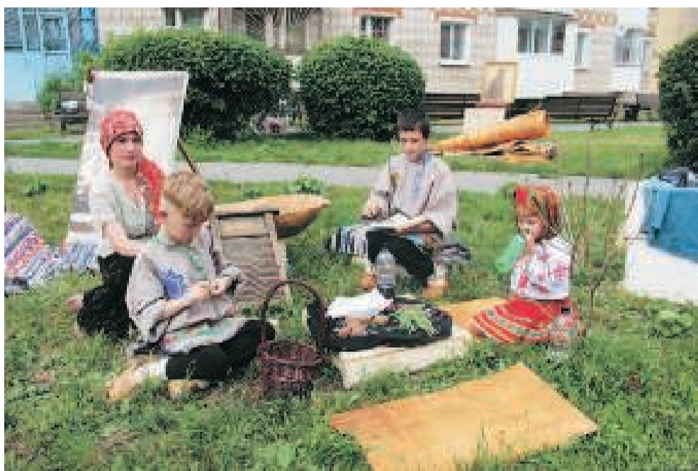
Музейная инсталляция «Первопоселенцы».

С самого утра маленьких горожан привлекали своей яркостью площадки с надувными батутами и разными игровыми аттракционами, торговые палатки с обилием сладостей, игрушек, воздушных шаров и других детских товаров. В общем, малышам и ребятам постарше забав на весь день хватило.