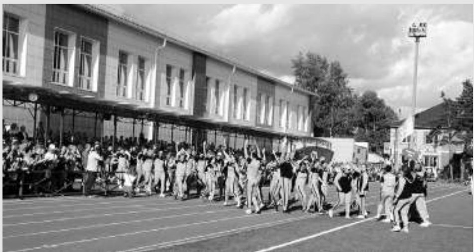
Под рукоплескания трибун на поле вышла сборная хозяев игр.

Те, кто не смог прийти на открытие игр, смогли посмотреть церемонию в интернете. Впервые прямую трансляцию провела Асиновская студия телевидения. По информации наших коллег, за три дня зафиксировано 2,3 тысячи просмотров.