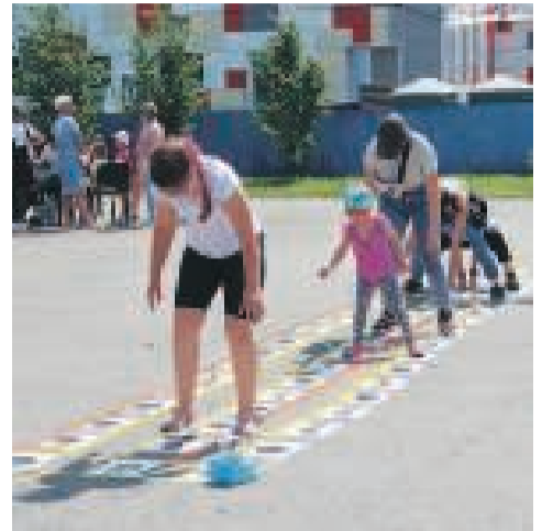
Одно из приключений от «пиратов» для маленьких асиновцев.