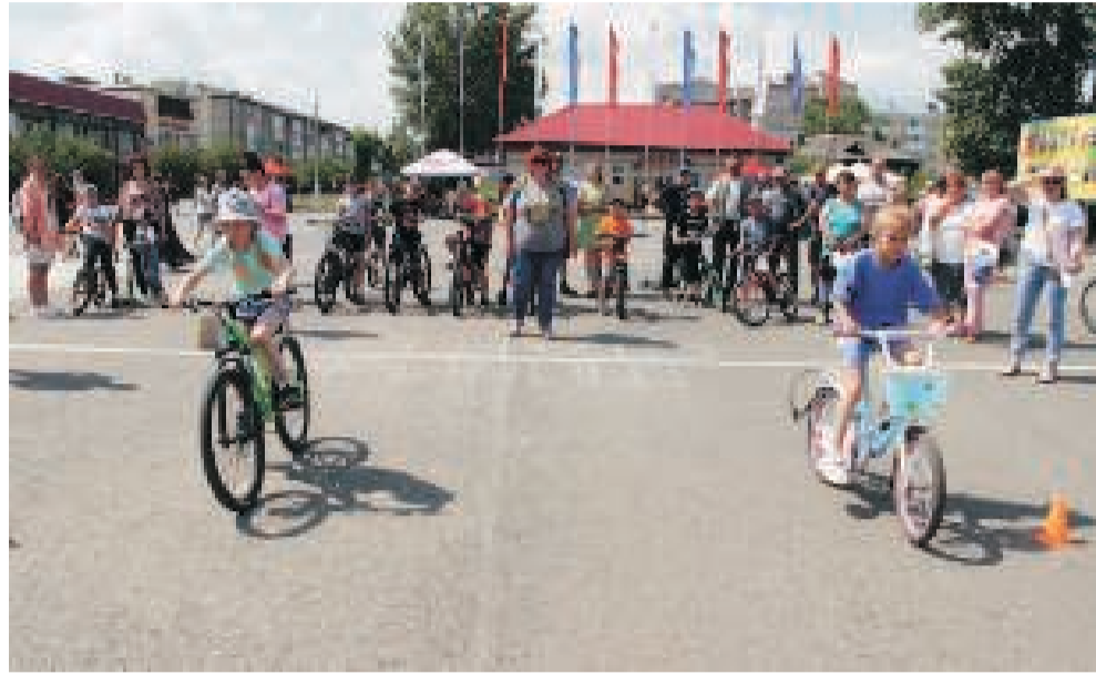
В «Большом заезде» приняли участие почти 50 маленьких гонщиков.