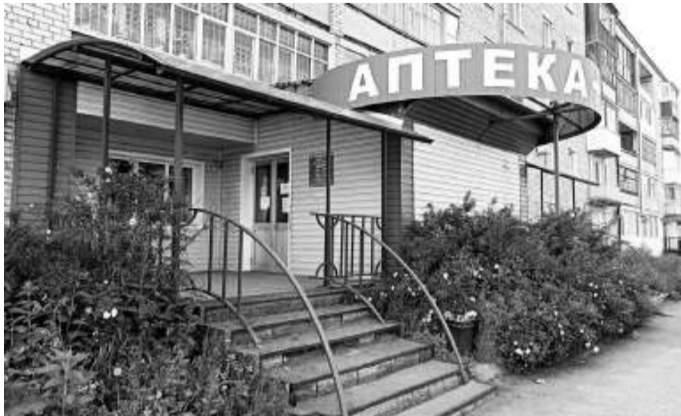
Центральная аптека уже закрыта.