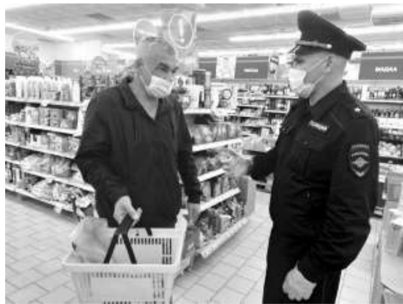
Большинство покупателей соблюдают масочный режим.

Задача состояла в том, чтобы проверить, насколько ответственно асиновцы относятся к продлению масочного режима на территории Томской области. В первую очередь проверяли торговые центры, магазины, точки общепита и общественный транспорт. В работу были включены практически все подразделения МО. Мы присоеди-