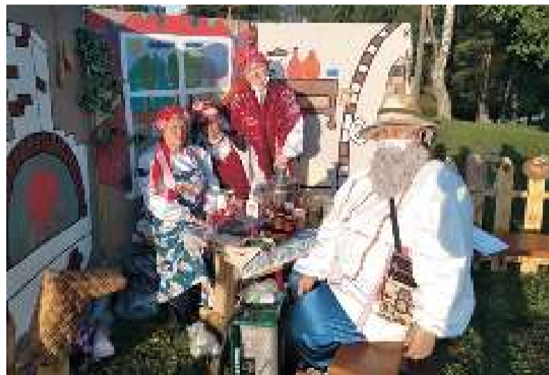
Жители Комсомольского поселения всех желающих приглашали к «своему шалашу».

На праздник приехали представители всех поселений Первомайского района. Даже ком-