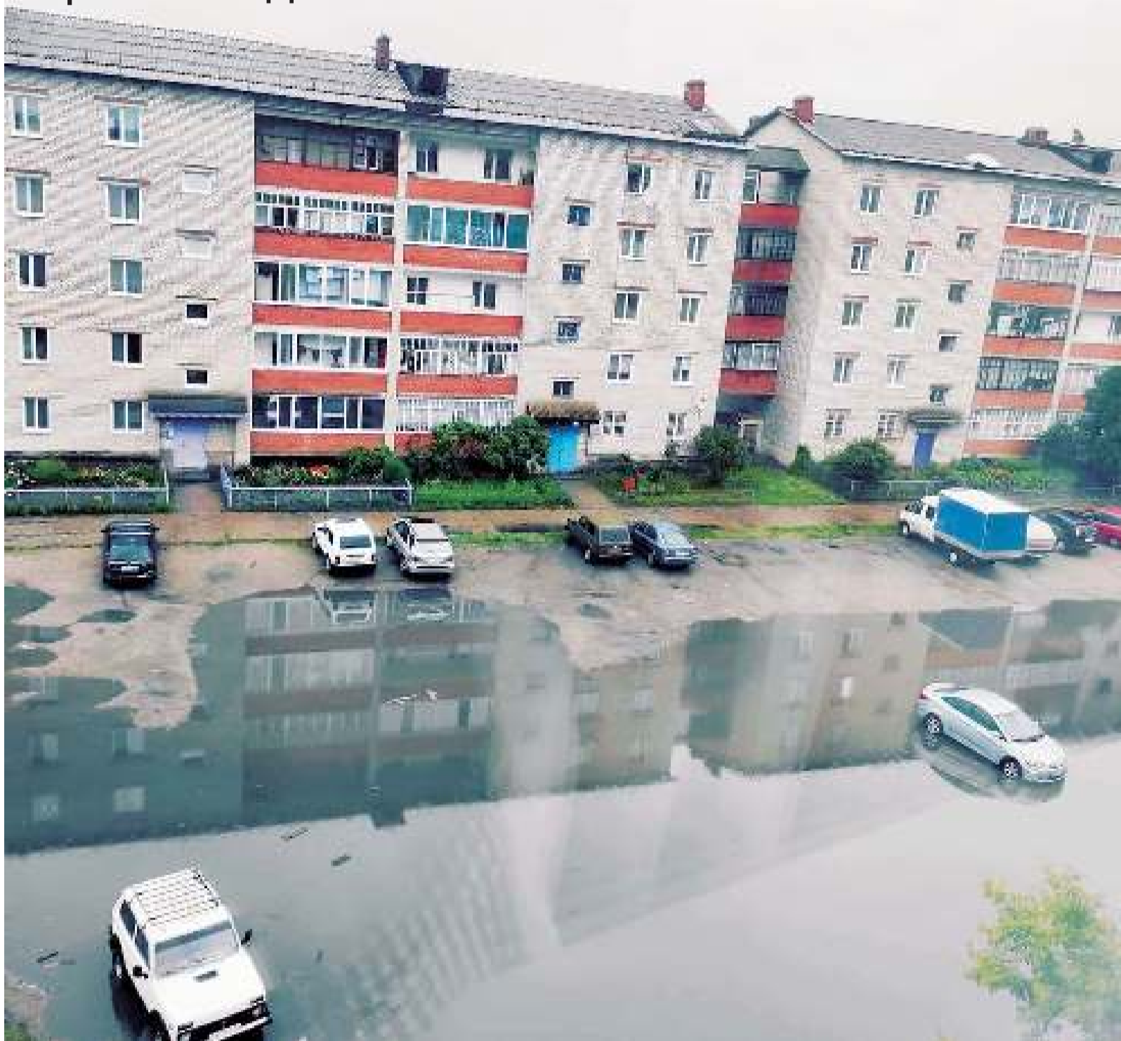
Фото двора по ул. Ленина, 88 прислал наш читатель А.Подгорнов.