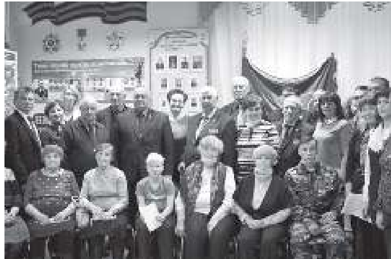
Фото на память после мероприятия в честь десятилетия музея АТпромИС.

— Как и насколько отлажена «обратная связь» с жителями Асиновского района? Как часто и с какими вопросами асиновцы обращаются к Вам как к депутату?