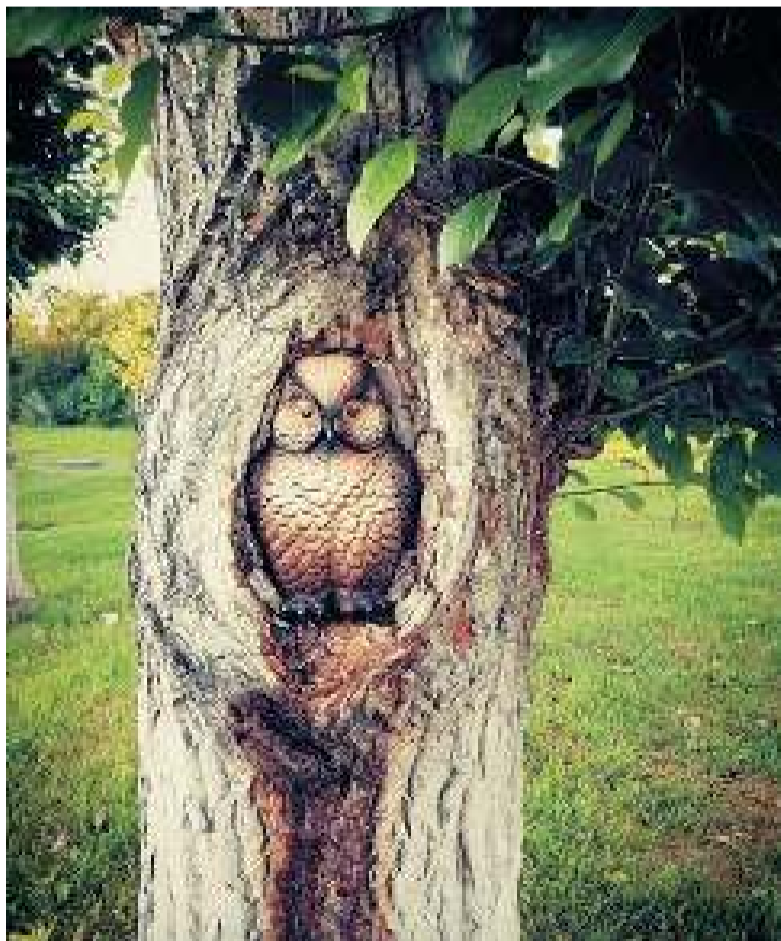
Фото присылайте на Ватсап 8-952-891-94-48.