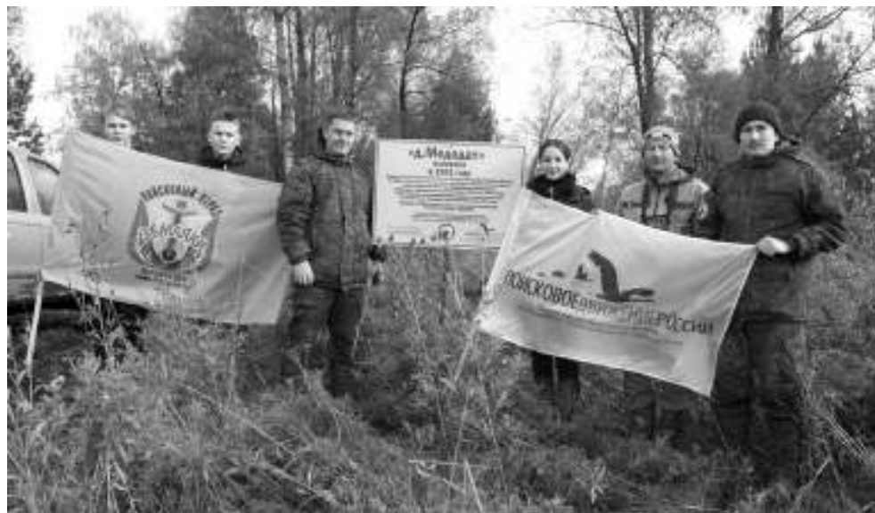
В последней экспедиции приняли участие первомайские поисковики и исследователи-краеведы.