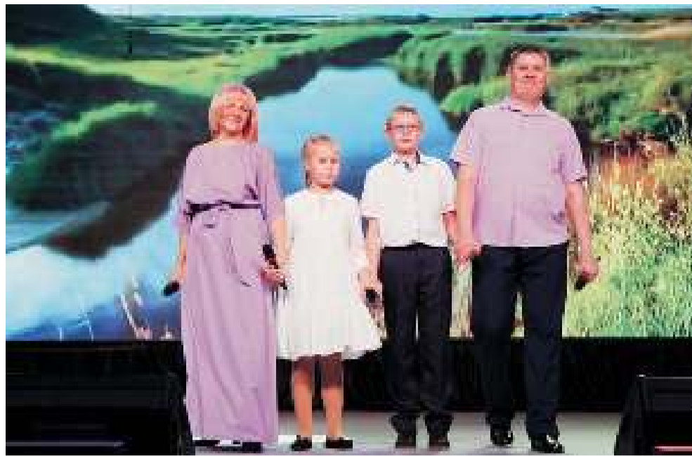
Семья Паниных стала обладателем высшей награды конкурса — Гран-при.

После того, как все поведали историю своей семьи и рассказали о своих интересах и увлечениях, участники перешли к