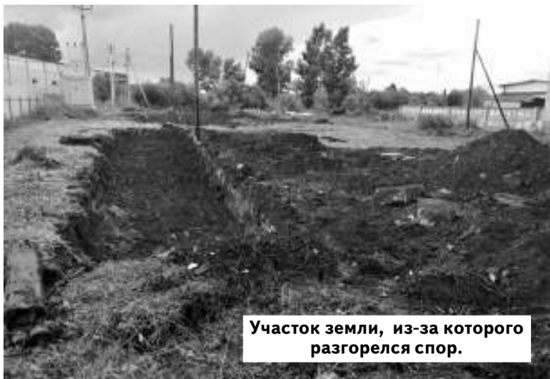
Участок земли, из-за которого разгорелся спор.