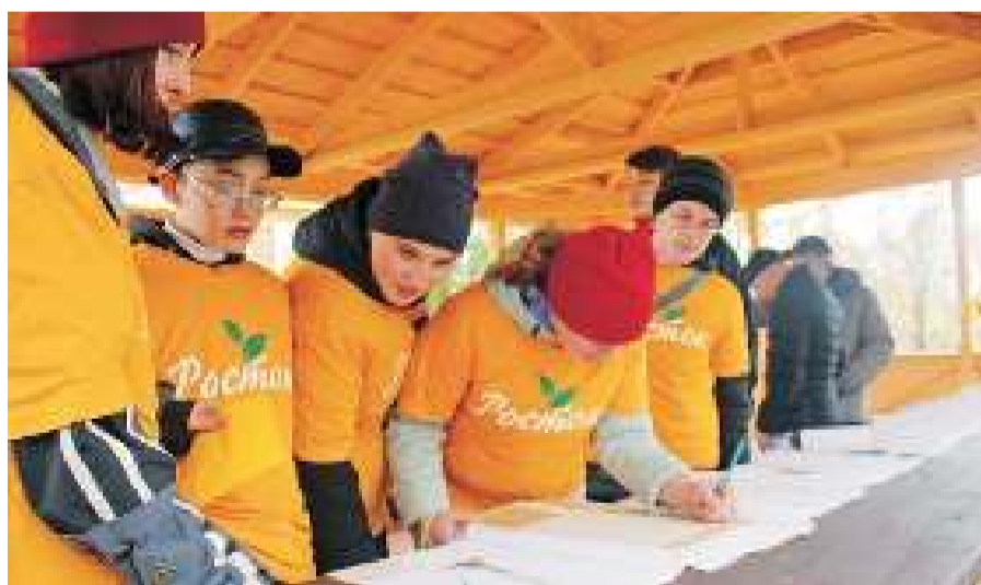
Батуринская команда «Росток» на станции «Ботаника» угадывает растения, представленные в гербарии.

Районный слёт юных экологов и биологов прошёл уже в 14-й раз