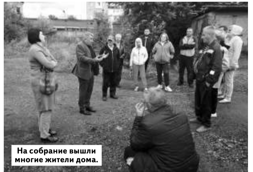
На собрание вышли многие жители дома.