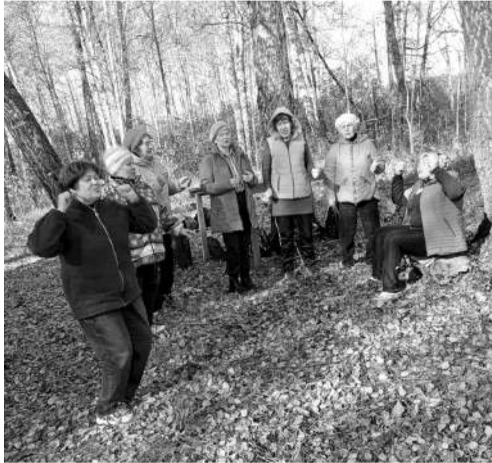
Первомайские пенсионеры не привыкли скучать. В связи с ограничениями все мероприятия они сейчас проводят на свежем воздухе. На этой неделе приходе осени отметили походом в лес.

— По жизни я оптимистка, поэтому не чувствую себя на свой возраст. В душе мне наполовину меньше, чем по паспорту. А вот праздники все отмечаю, для того они в календаре и есть. Раньше ходила в объединение для пенсионеров «Шире круг». День старшего поколения обязательно отмечали. Всегда готовили программу, весело было. А сейчас уже