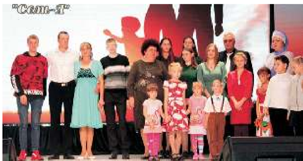
В первом районном фестивале-конкурсе «Семь-Я» приняли участие семь семей из города и деревень.