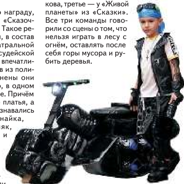
Байкер на мотоцикле из пластиковых бутылок из команды детского сада «Пчёлка».

Среди агитбригад первое место заняли «Юные экологи» из «Белочки», второе место — у «Капельки» из Ново-Кускова, третье — у «Живой планеты» из «Сказки». Все три команды говорили со сцены о том, что нельзя играть в лесу с огнём, оставлять после себя горы мусора и рубить деревья.