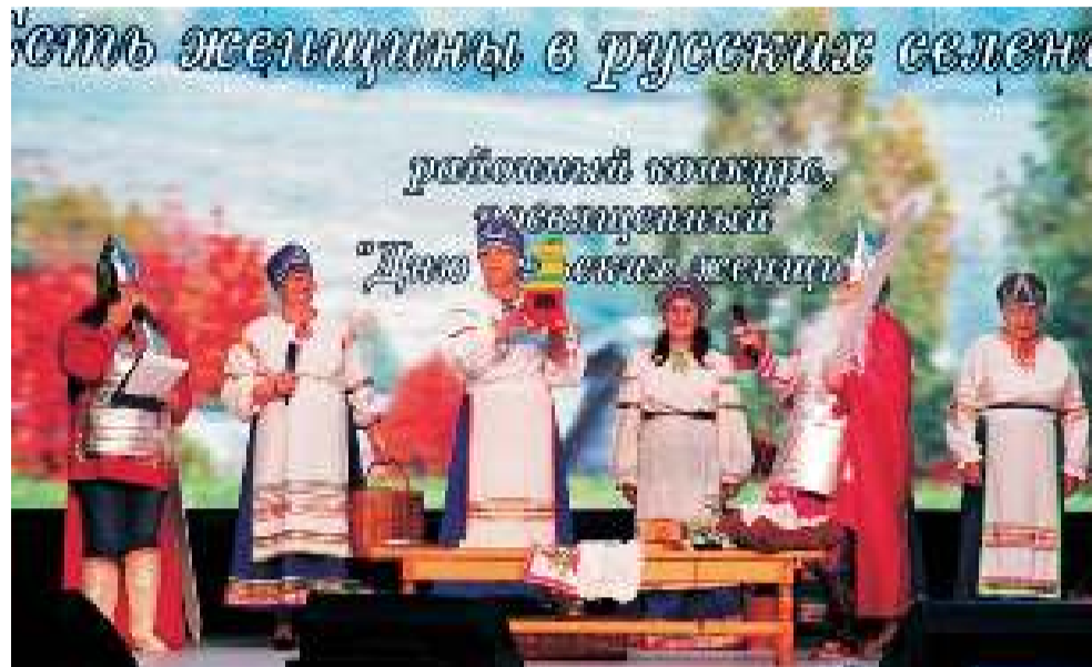
Коллектив «Сударыня» из Ягодного стал «самым оптимистичным» участником конкурса.

В этом году организаторы отступили от привычного конкурсного формата: в отличие от прошлых лет, на сцену ДК «Восток» выходили не отдельные героини, а целые женские коллективы, где каждая участница обладает индивидуальными творческими способностями, своей житейской мудростью, кулинарными умениями и т.д. Вместе они создавали уникальный образ сельской труженицы. Восхваляя её на все лады, соперники не стремились к конкуренции, что и сказалось на итогах: каждой из шести команд была присвоена победа в отдельной номинации. Кому в какой, решали члены жюри после просмотра всех испытаний, которых было четыре: визитка «Барышни-крестьянки», декоративно-прикладной конкурс «Чудо-ручки — чудо-штучки», кулинарный — «Рецепты» и творческий — «Я и спеть смогу, и сплясать смогу».