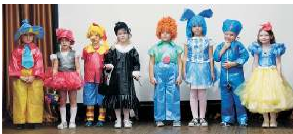
В «Театре моды» команда «Сказочный патруль» из «Солнышка» завоевала Гран-при, а команда «Журавушки», отправившая зрителей в космическое путешествие, — первое место.

призывали маленькие участники конкурса «Я живу на красивой планете»