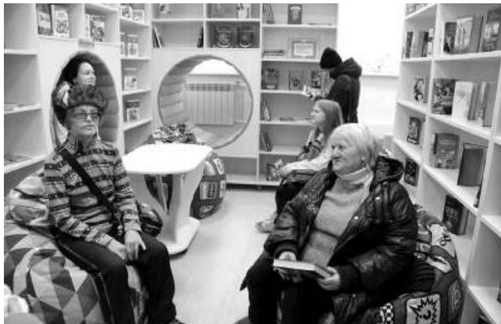
После капитального ремонта модельная библиотека-филиал №2 на ул. Тельмана стала современным культурным и общественным центром (фото сделано в 2019 году в день торжественного открытия библиотеки).