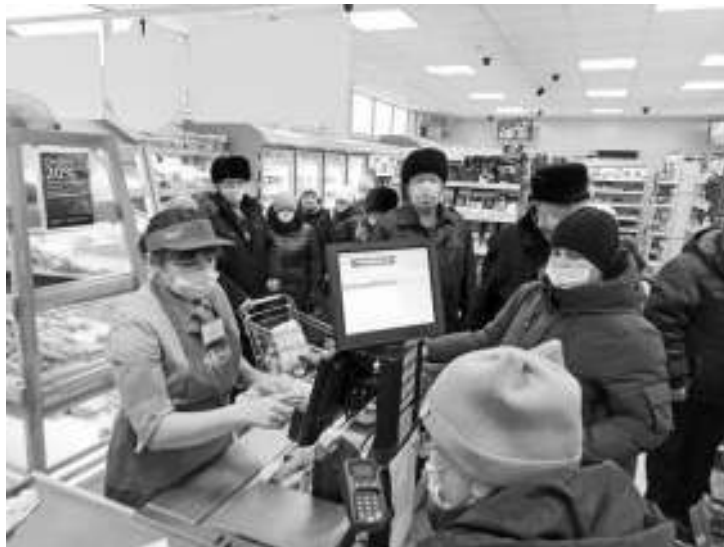
В магазине «Ярче!» покупатели не соблюдали безопасную дистанцию, так как работала всего одна касса.

Как отметили в департаменте здравоохранения Томской области, за последний месяц темп вакцинации увеличился с 1466 человек в сутки (данные на 10 октября) до 5417 человек (данные на 10 ноября). Максимальное количество привитых в сутки, 8739 человек, зафиксировано 1 ноября.