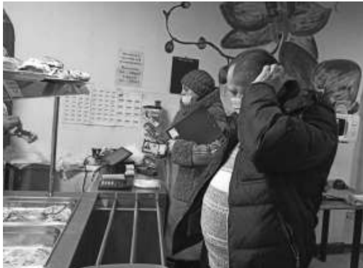
У посетителя кафе «Орхидея» QR-кода не оказалось, и он остался без обеда.