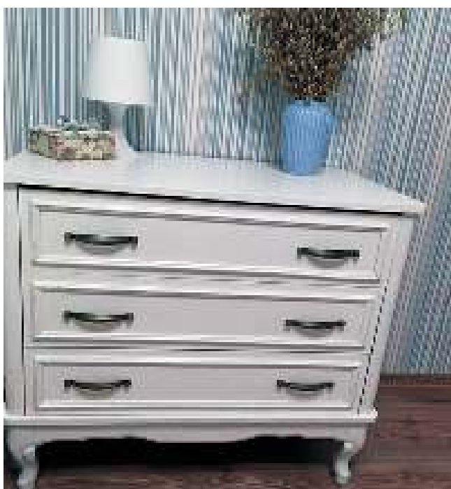
Старые предметы быта после реставрации обрели вторую жизнь.