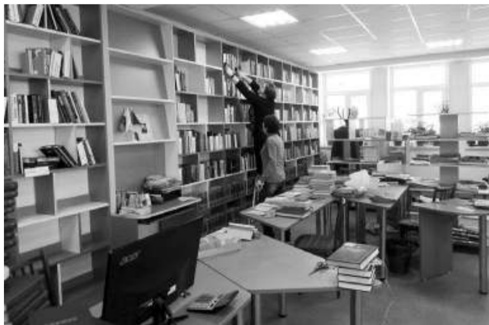
В читальном зале книги уже занимают своё место.

Коллектив детской библиотеки БЭЦ поделился планами работы на будущий год