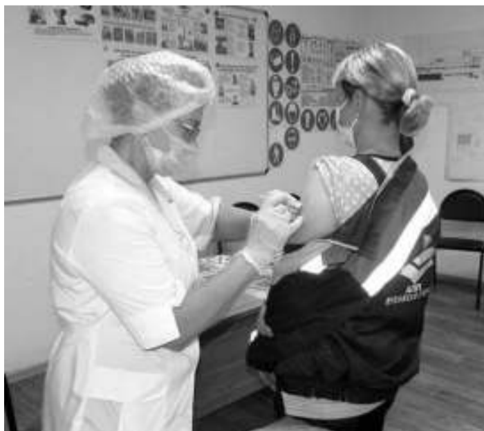
Выездная вакцинация прошла на нескольких городских предприятиях.

Более 15 тысяч жителей Асиновского района прошли вакцинацию от COVID-19