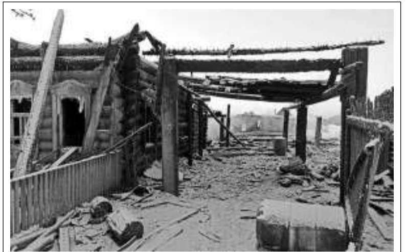
Всё, что осталось от усадьбы в с. Ново-Кусково на улице Школьной.

Следователями СО ОМВД России по Зырянскому району возбуждены уголовные дела по признакам преступления, предусмотренного частью 2 статьи 228 УК РФ.