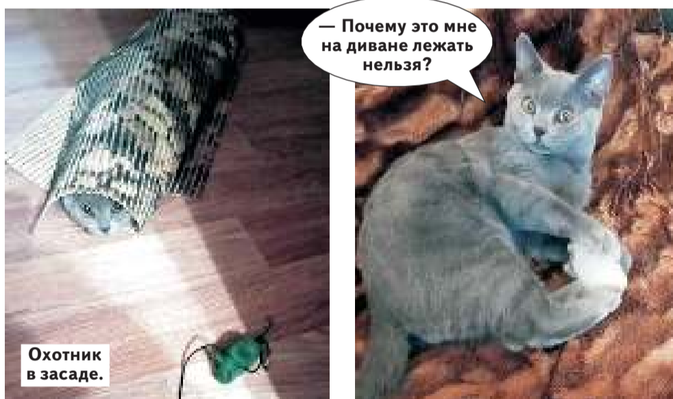
Охотник в засаде.