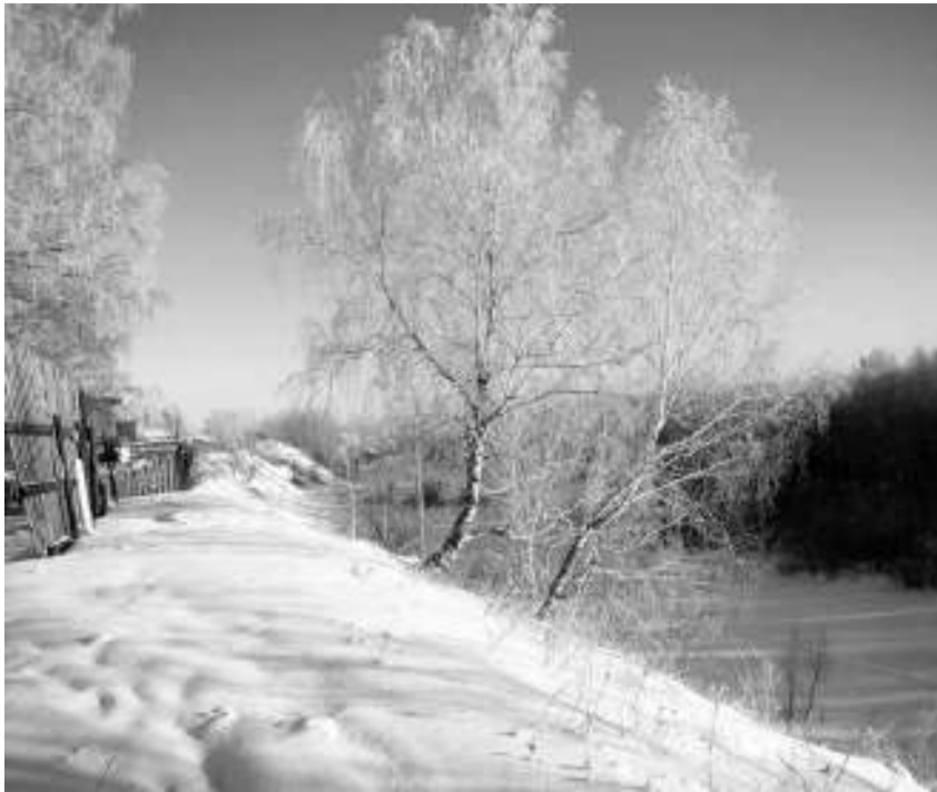
«Берёзы в инее». Фото Татьяны НЕБЕРО, с. Первомайское.