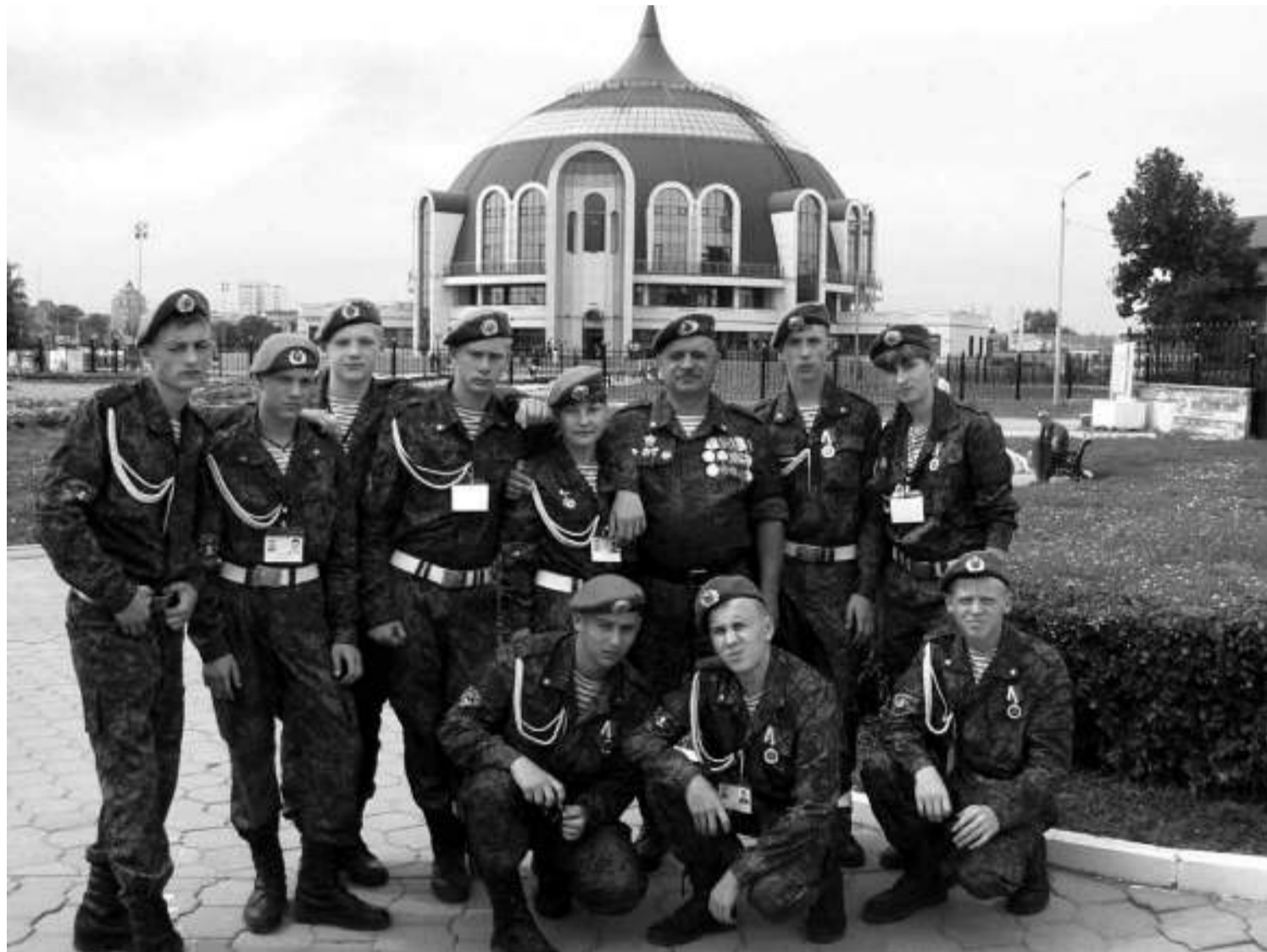
На всероссийских соревнованиях по военно-прикладным видам в г. Тула.