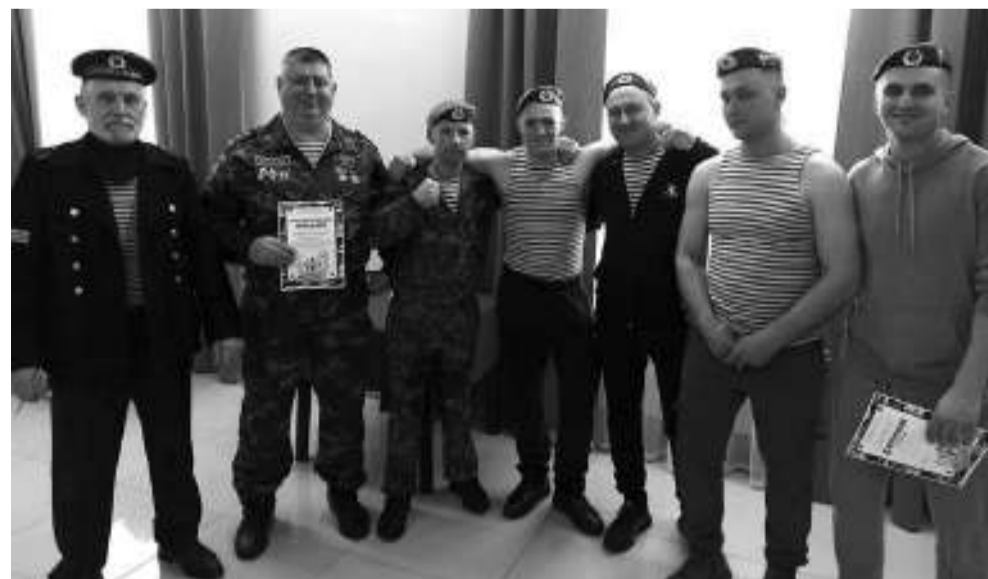
Победителем соревнований стала команда ВДВ.