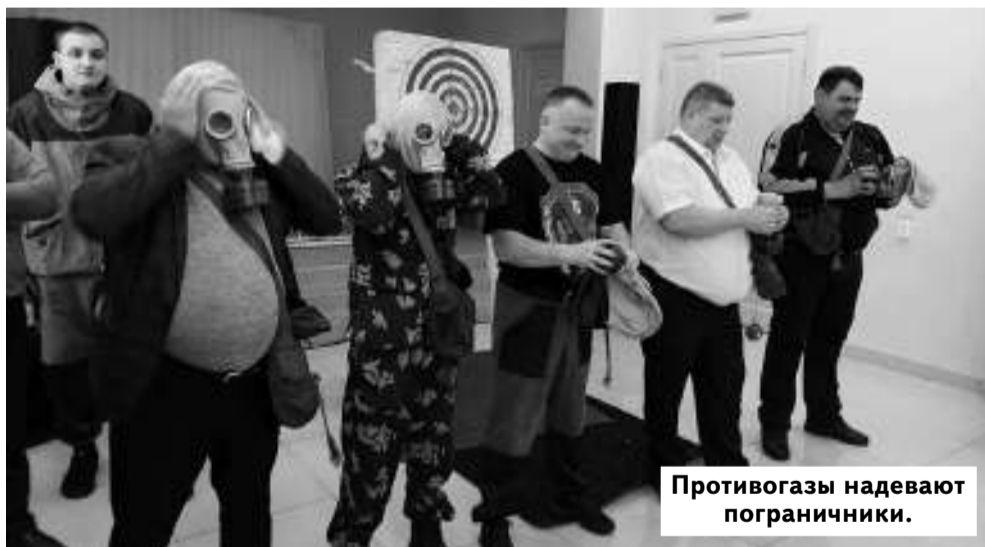
Противогазы надевают пограничники.

В честь Дня защитника Отечества мужчины выясняли, кто лучше помнит армейские навыки