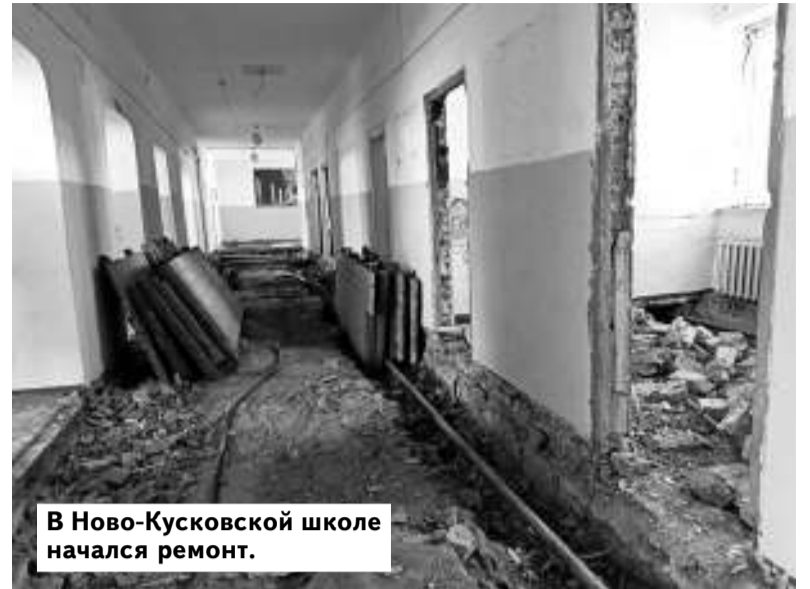
В Ново-Кусковской школе начался ремонт.