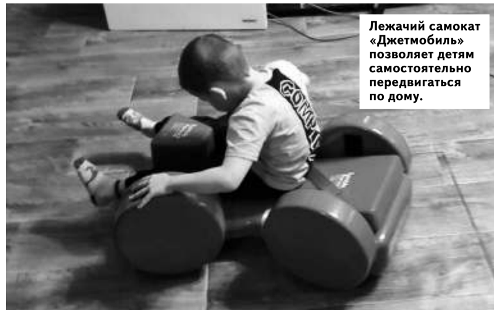
Лежачий самокат «Джетмобиль» позволяет детям самостоятельно передвигаться по дому.