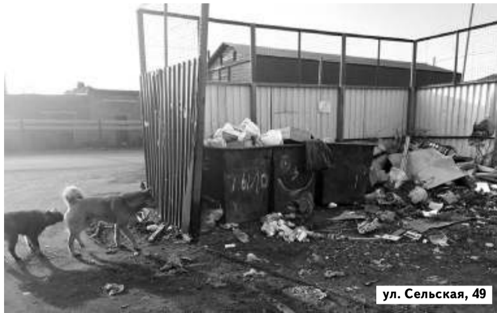
ул. Сельская, 49

Один в один ситуация и на улице Ивана Буева, 40. К контейнерам даже мусоровоз подъехать не может: всё вокруг завалено заполненными хозяйственными мешками, досками, старыми по-