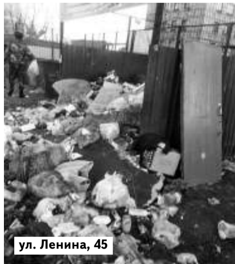
ул. Ленина, 45

крышками, бытовым мусором, обрезанными ветками. Аналогичная картина и во дворе дома №45 по улице Ленина. Фотографию мусорного безобразия прислала нам читательница с комментарием: «Баки опустошают, а помойку не убирают вообще. За что мы платим?»