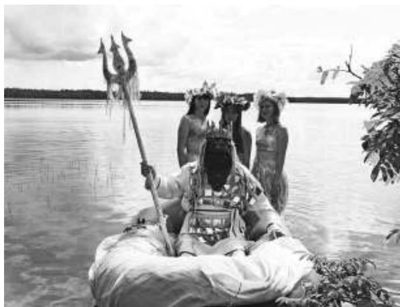
Из глади озёрной появился чертанский владыка в сопровождении русалок.

Накупувшись, насмеявшись и надурочившись, пенсионеры с удовольствием отведали «чертановской» ухи, пообещав вернуться сюда на следующий год. Ведь это место чертовски привлекательно!