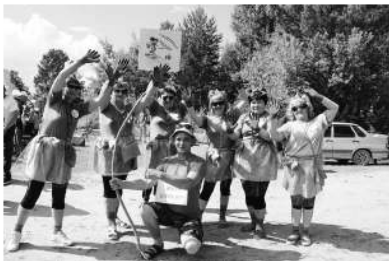
Команда «Гламурные кваки» из посёлка Сайга.