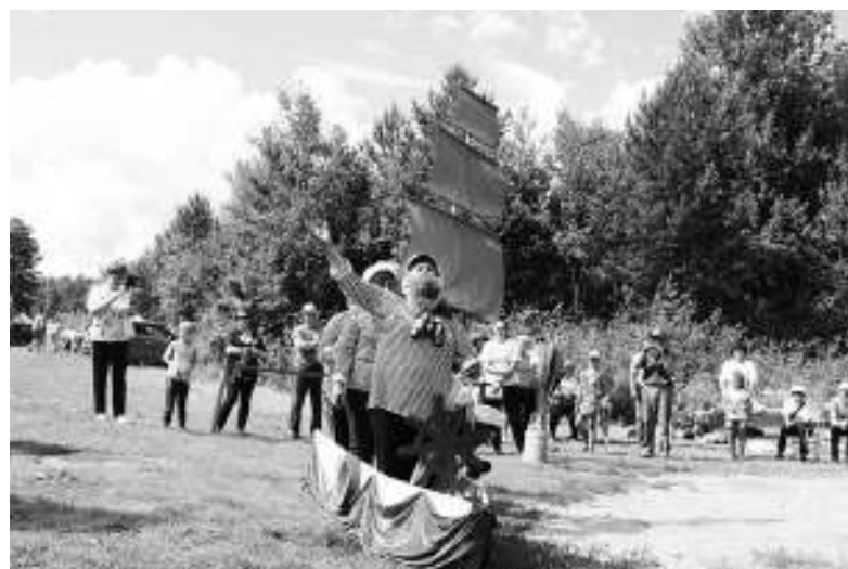
Команда «Алые паруса» «приплыла» на корабле.

кам красоту, а женщинам и мужчинам – удачу и здоровье. Весело дурачились «Сергеевские комарики», устроившие нападение на бедного рыбака, пытавшегося