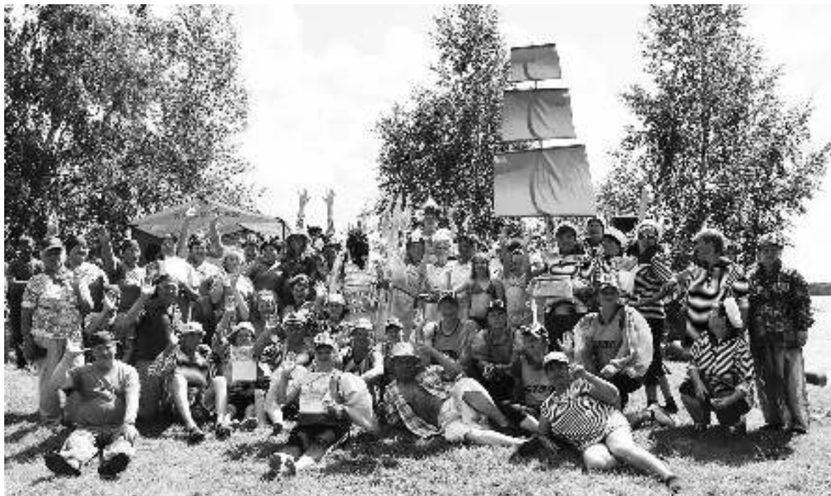
Общее фото участников праздника на память.

Вдохновения и правда было хоть отбавляй! Команда «Камыши» исполнила задорные частушки под гармонь, а потом преподнесла в подарок жюри кадущку с камышами. Старинный обряд освящения показала команда «Агидель». Организовав хоровод и заговорив кувшин с чертанской водой волшебными словами: «Агидель – воды богиня, силы жизни берегиня. Очищает душу, тело, чтобы тело молодело», представительницы клубного объединения «Сударушки» дарили девуш-