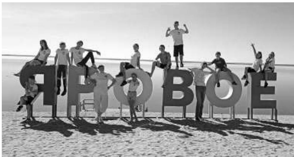
Первые тренировочные сборы пловцов ДЮСШ-2 прошли в Яровом.

Асиновцы тренировались бок о бок со спортсменами из Новосибирска, Красноярска, Кемерово, что давало им дополнительный стимул быть лучше и профессиональнее. По словам педагога, тренировки в горах в условиях недостатка кислорода развивают выносливость организма при привычных нагрузках, которые на равнине будут казаться намного легче. А это значит, что занятия станут более эффективными, а результаты — высокими.