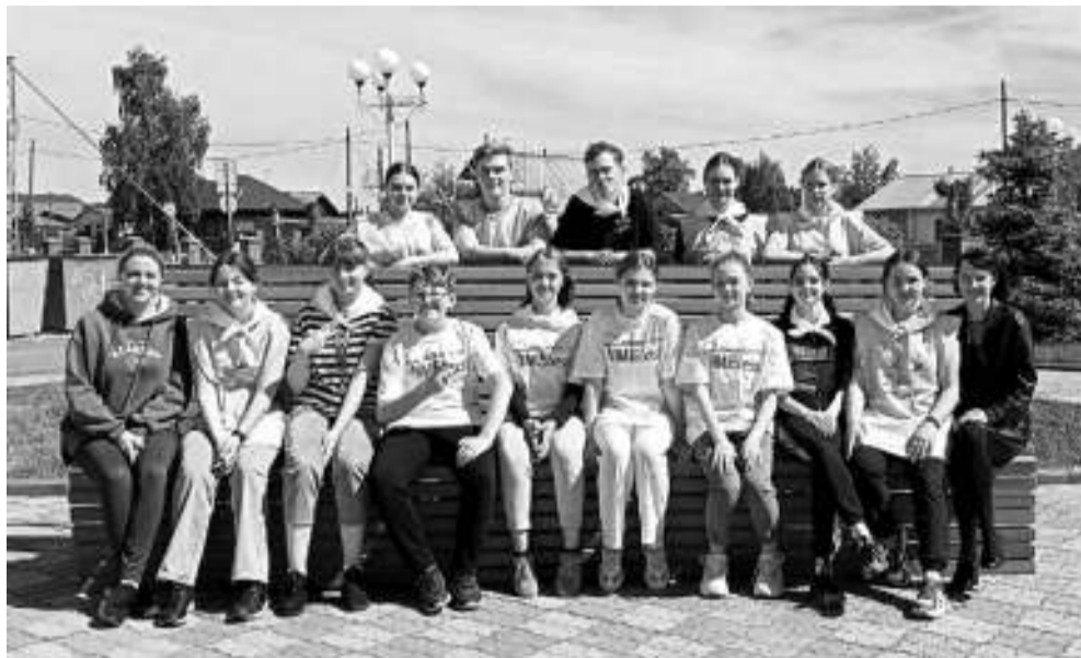
В молодёжном совете — самые активные школьники и студенты села Первомайского.

Молодёжный совет Первомайского района летом провёл массу мероприятий