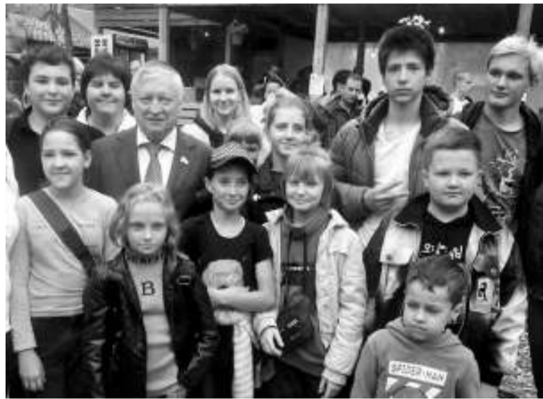
Анатолий Карпов никому не отказывал в совместной фотографии. Снимок с гроссмейстером теперь есть и у угонденских школьников.

Асиновские шахматисты стали участниками фестиваля «Лучшая партия», который посетил чемпион мира Анатолий Карпов