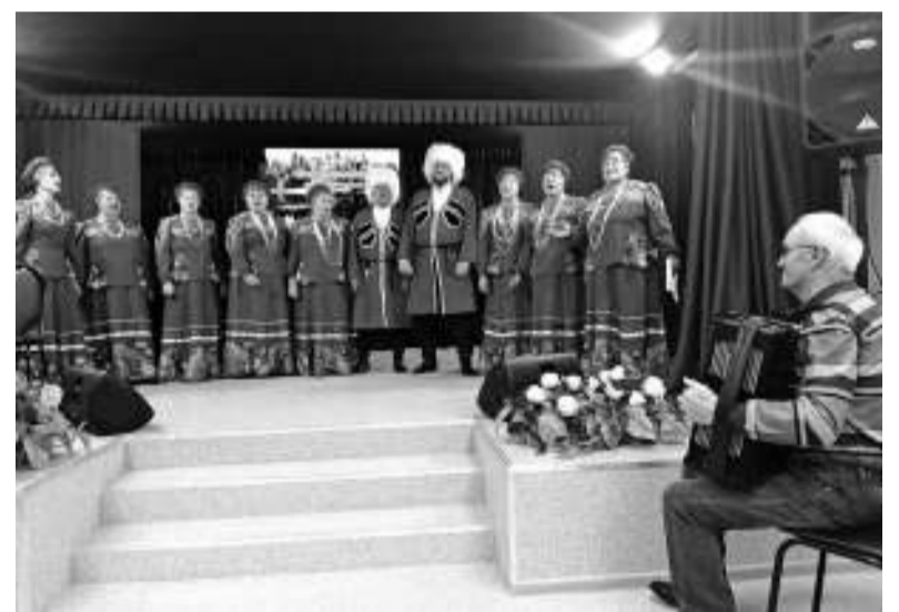
Выступает вокальный ансамбль «Казачье раздолье».

По восхищённым возгласам было понятно, что изменённое внутреннее пространство в белых, сине-голубых, фиштаконных, жёлтых и зелёных тонах дороховцам пришлось по душе. В одном из залов для первых посетителей было организовано несколько выставок, на которых представили историю