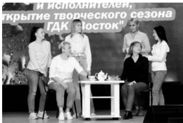
Театральному коллективу «Интермедия» всего два года, при этом он часто появляется на районной сцене.

В минувшую пятницу состоялся традиционный концерт, посвящённый открытию творческого сезона, участниками которого стали музыкальные, театральные и хореографические коллективы ДК «Восток», которые, по замыслу режиссёра мероприятия Натальи Бедаревой, презентовали зрителям результаты своей работы. Были представлены как известные коллективы, становившиеся победителями всероссийских и международных конкурсов, так и совсем молодые, но уже имеющие своих звёздочек.