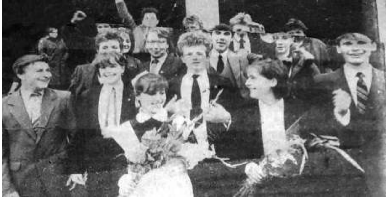
Члены строительного отряда «АТОС» — на крыльце родной школы 1 сентября 1987 года. Это фото было сделано корреспондентом областной газеты «Молодой ленинец».

Такое мушкетёрское название получил 35 лет назад школьный стройотряд. Расшифровывалось оно так: Асиновское трудовое объединение старшеклассников