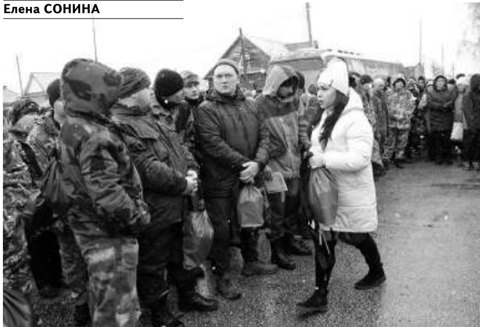
Волонтеры раздали мобилизованным подготовленные местными предпринимателями вещмешки.

Очередная отправка жителей Асиновского и Первомайского районов в рамках кампании частичной мобилизации состоялась 27 и 28 октября. В первый день родные и друзья отправили в дорогу 34 человека, на следующий день — 46 (это самая масштабная отправка за время действия частичной мобилизации). Причём большинство из общего числа мужчин, отправленных в октябре, — добровольцы.