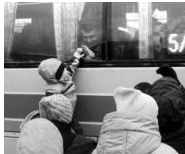
— Папа, я тебя буду очень ждать!

Из Асины мобилизованных отправили в Томск, а затем — в Челябинскую область. Напомним, что первый автобус с военнослужащими ушёл 26 сентября, провозжали мужчин и в последующие три дня. Всего за время действия объявленной президентом частичной мобилизации военный комиссариат по Асиновскому и Первомайскому районам должен был отправить 180 человек. Эта задача выполнена. В конце месяца президент страны официально объявил завершение мобилизации.