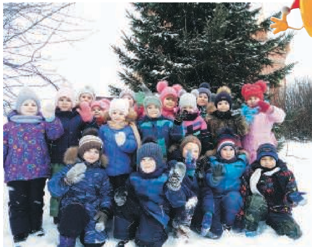
Новокусовские ребяташки, Девчонки и мальчишки, Все у ёлки собрались, Новый год уж заждались!

Фото присылайте на нашу почту: obzregion@mail.ru или в ватсап по тел. 8-913-810-86-77. Не забывайте указывать свои ФИО и делать подписи к снимкам!