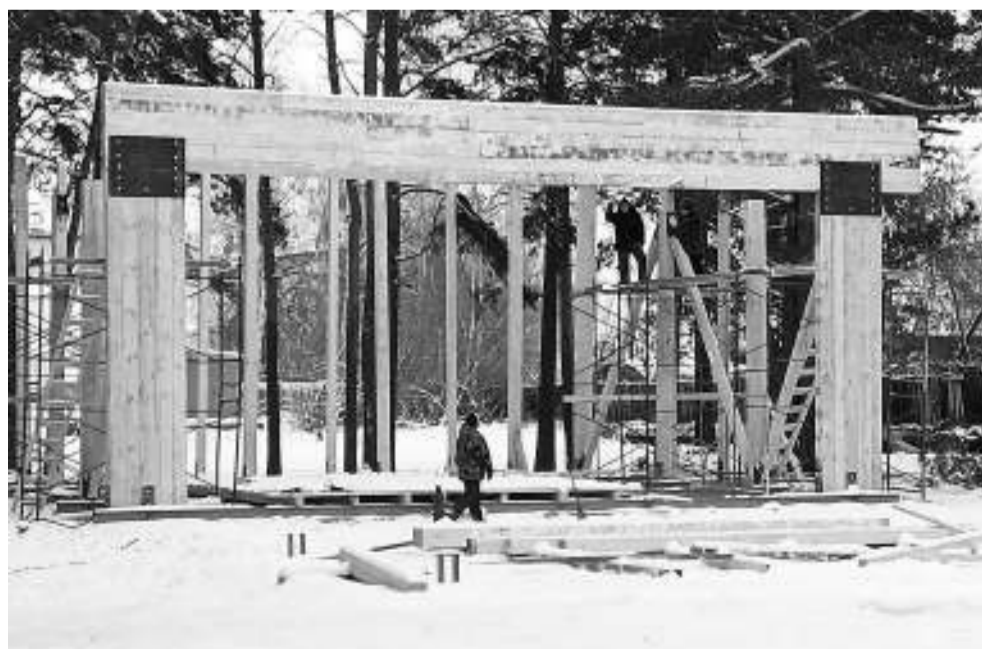
В горсад у достраивается центральная сцена.

Продолжая тему благоустройства, нельзя не рассказать о реализации другой важной программы — «Безопасные дороги». В этом году было отремонтировано асфальтовое покрытие на протяжённости 1,7 километра, отсыпано 7,5 километра грунтовых дорог. По программе «Комфортная городская среда», признаюсь, не смогли реализовать всё задуманное. Проектировали работы на 12 миллионов (пешеходные дорож-