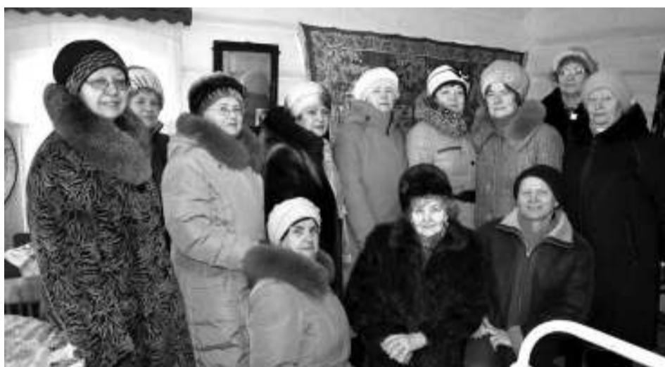
Члены Первомайского отделения Союза пенсионеров — в музее села Зырянского.