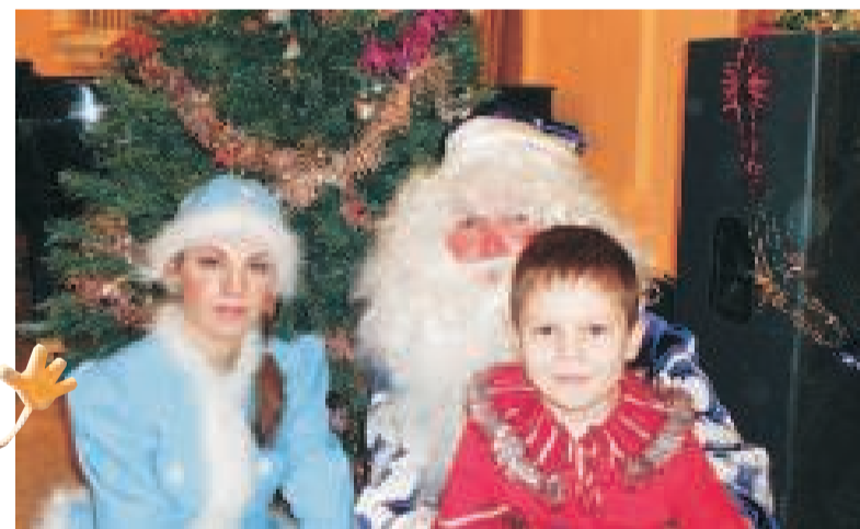
В гостях у Деда Мороза и Снегурочки.