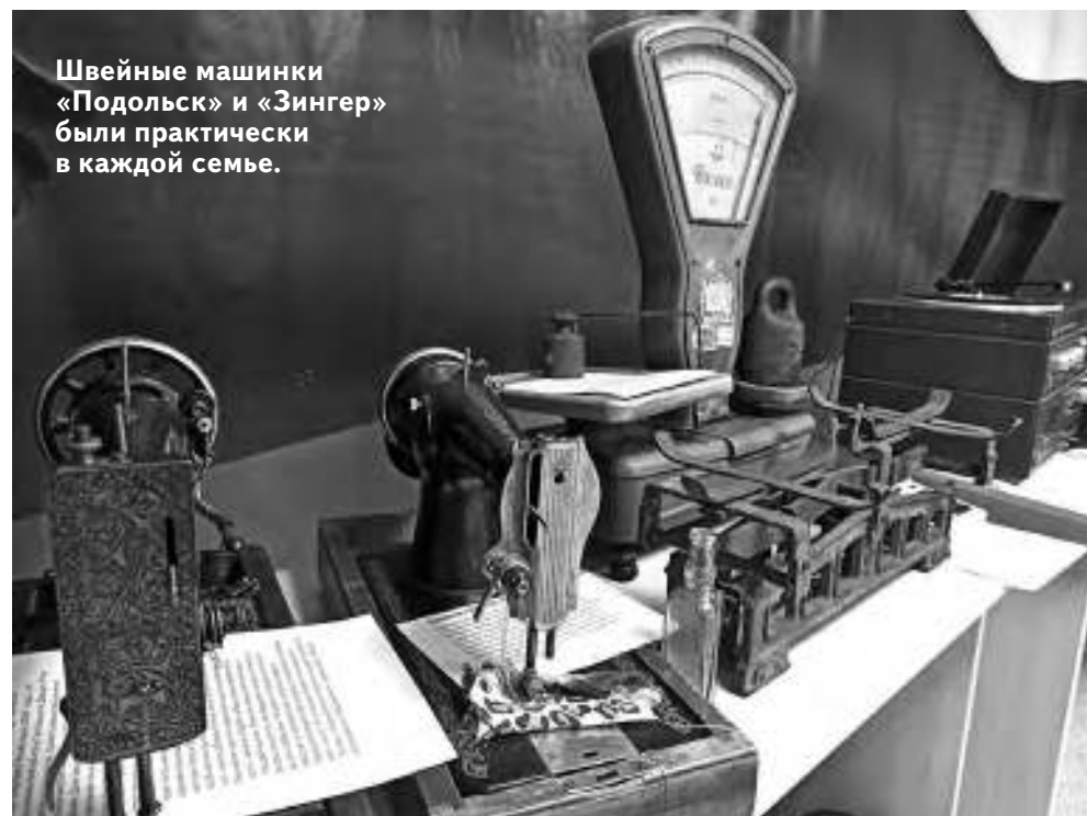
Швейные машинки «Подольск» и «Зингер» были практически в каждой семье.