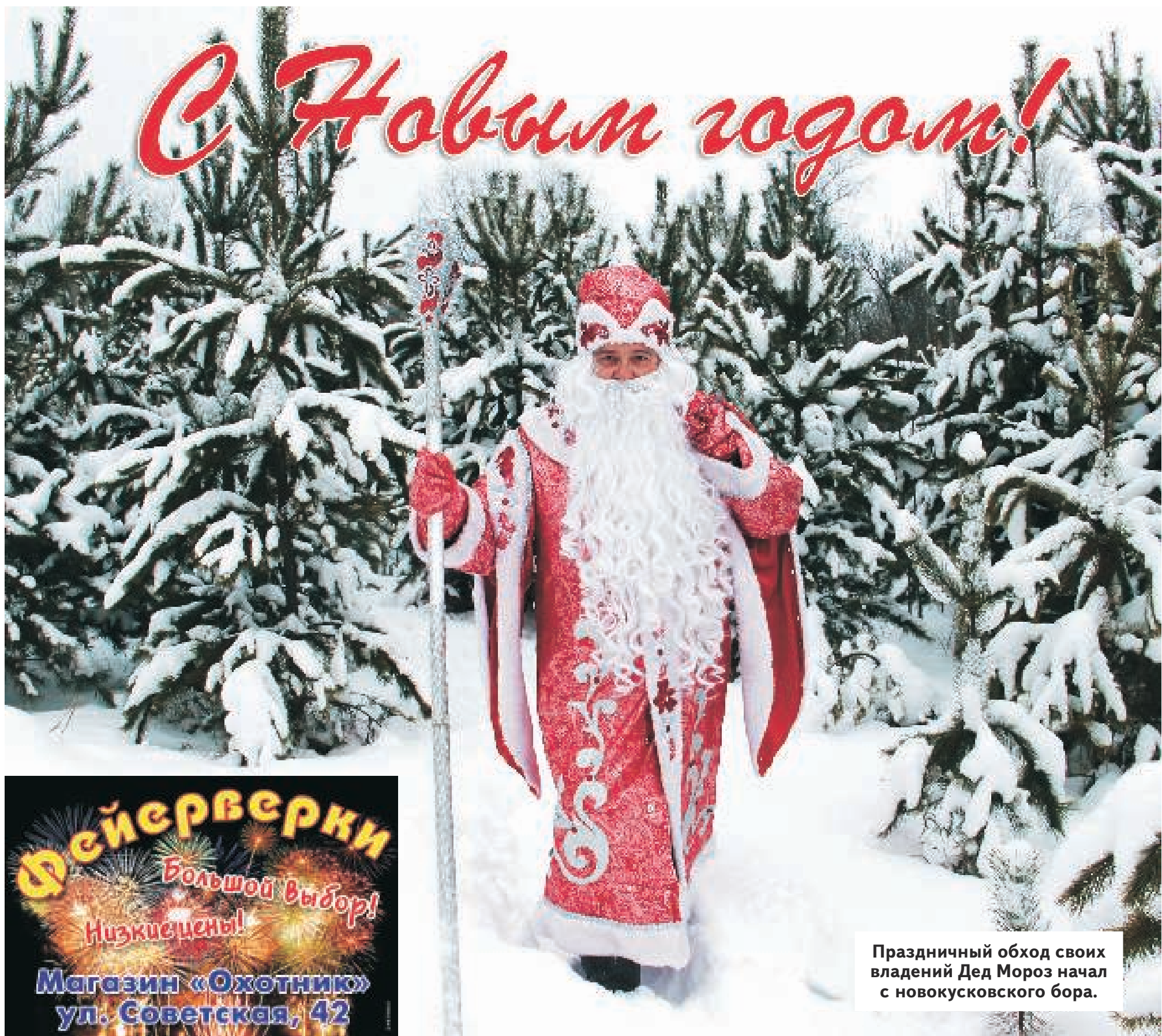
Праздничный обход своих владений Дед Мороз начал с новокусовского бора.