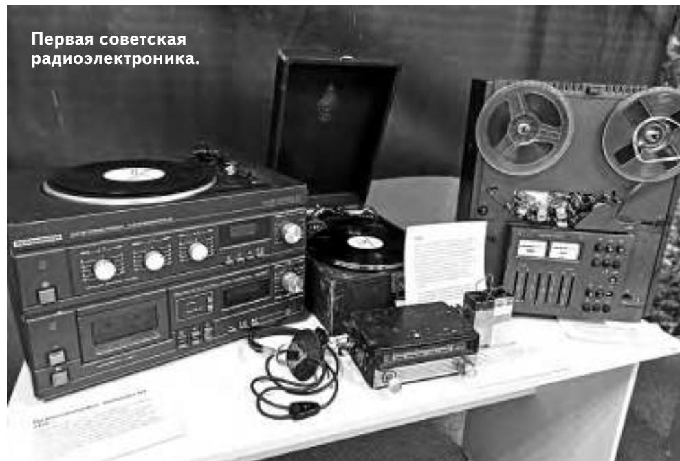
Первая советская радиоэлектроника.