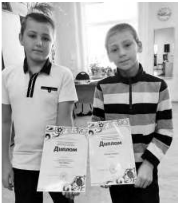
◀ За два года мальчишки добились успехов в учёбе, спорте и творчестве, о чём свидетельствуют их награды.

полно сладостей, и никто не запрещает полакомиться ими в любой момент. Могут порой напроказничать или соврать. Родители стараются проявить мудрость, помочь исправить ситуацию.