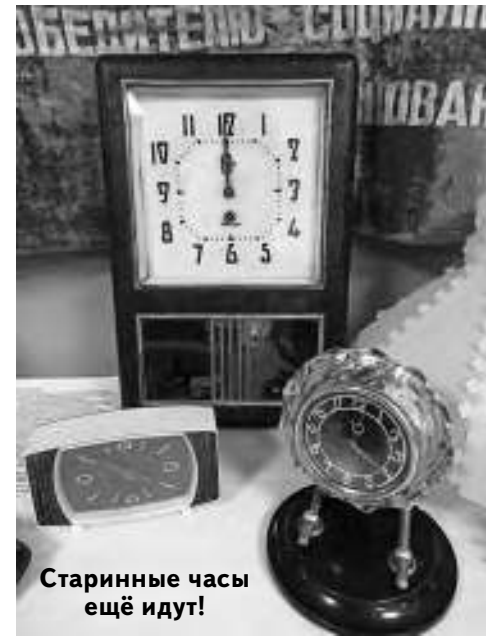
Старинные часы ещё идут!

Увы, Союз нерушимый мы не сохранили, но осталась добрая память, которая хранится не только в наших сердцах, но и в старых предметах, произведённых в эпоху СССР.