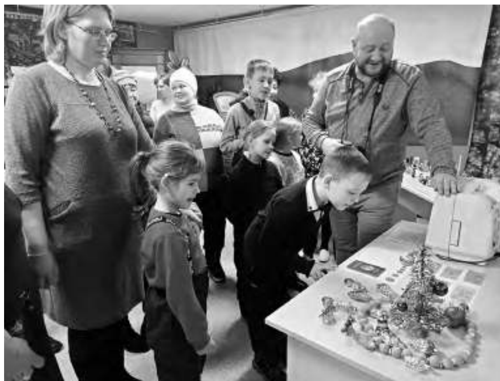
Детей очень заинтересовали советские деньги и ёлочные игрушки.

Сегодня существует множество приборов, которые облегчают женщинам работу по дому. В советские годы такого разнообразия не было, но